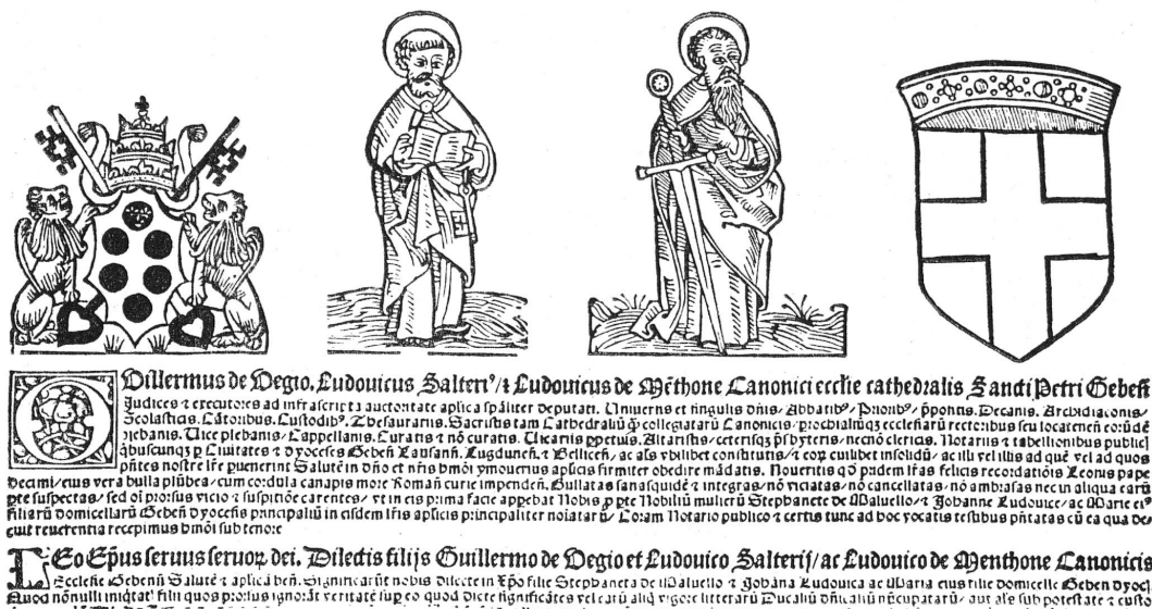
FIG. 2. — Jugement rendu par trois chanoines de l'église de Saint-Pierre de Genève (1522). Imprimé à Genève. (Réduction de moitié).

Un second exemplaire, non mutilé, se trouve aux Archives d'Etat de Genève (fig. 2).