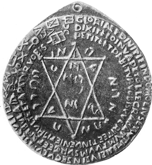
Pl. XII. — Médaille talismanique. En haut, face A; en bas, face B. Musée de Genève.