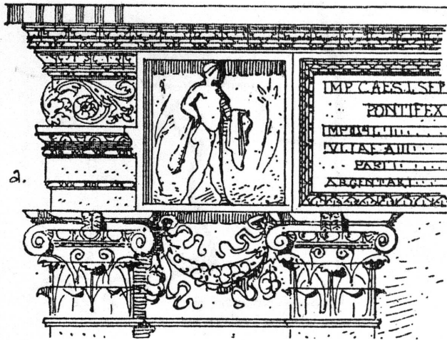
FIG. 2. — Décoration de la Porte du Forum Boarium (Rome).

Il avait fait solidement occuper les Alpes Cottiennes pour empêcher un mouvement tournant de son adversaire (Hérodien III 6: τὰ στενὰ τῶν Ἀλπέων καταληψόμενον, ayant occupé les cols des Alpes).