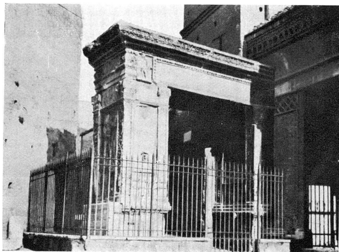
FIG. 3. — Porte des Argentarii et Boarii au Forum Boarium.

Comme Albinus occupait tout le bassin du Rhône au sud de Lyon, il est évident que