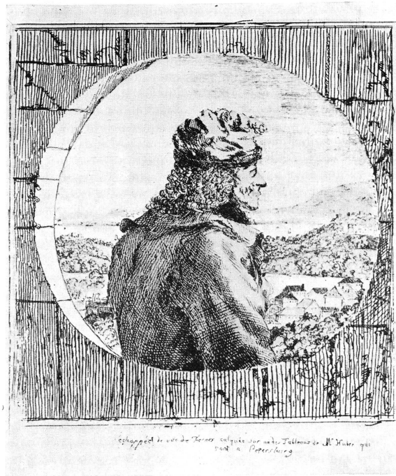
Pl. VI. — J. Huber (1721-1786). Portraits de Voltaire. « Echappée de vue de Fernex ». Type a et type b.