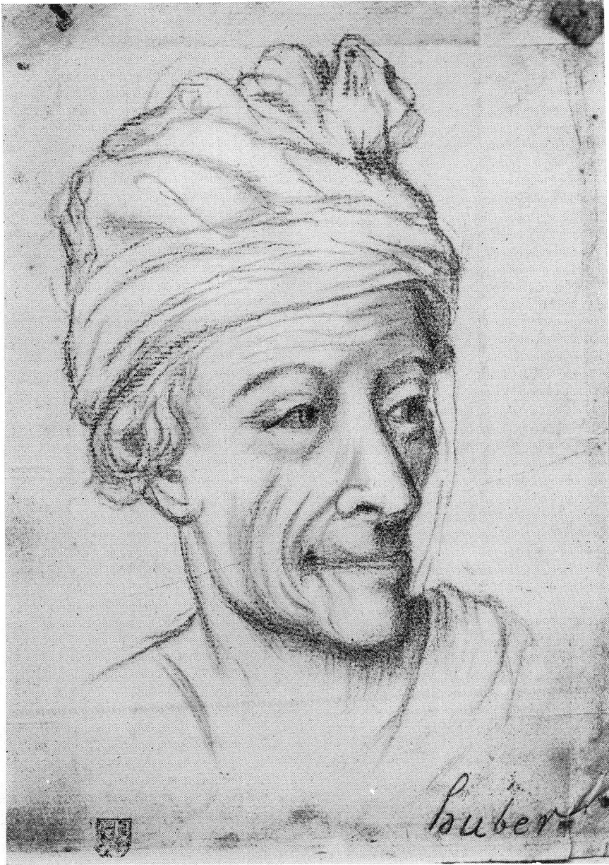
PL. IV. — Voltaire, dessin. — Genève, Musée d'Art et d'Histoire.