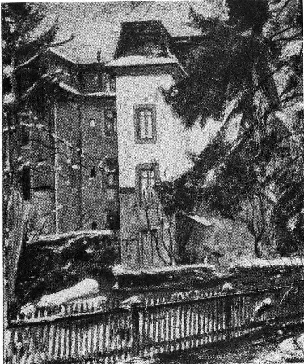
PL. III. — Martin Lauterbourg. Hiver.