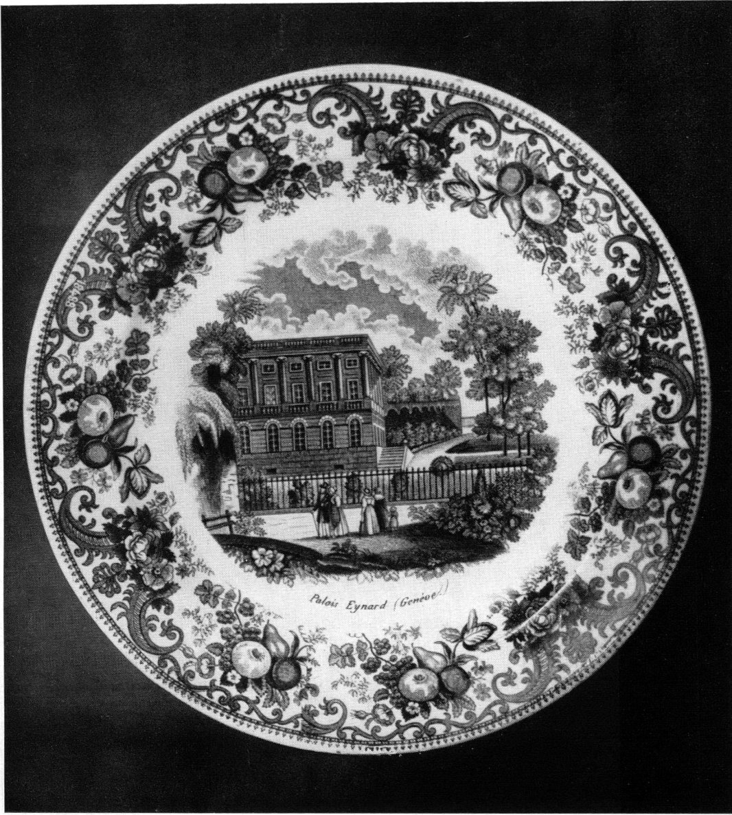
PL. II. — Faïence de Nyon à décor bleu imprimé: « Palais Eynard, Genève ». Musée Ariana, Genève.