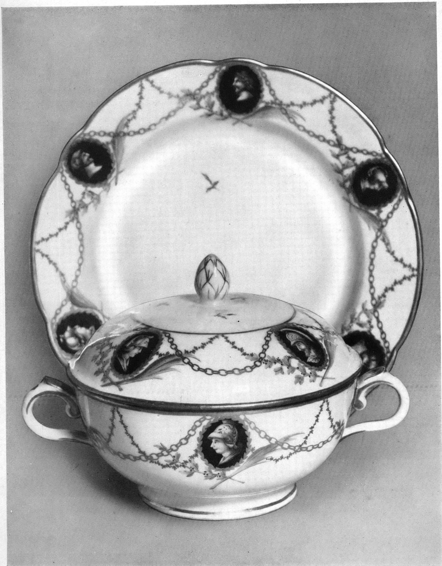
PL. III. — Porcelaine de Nyon. Musée Ariana, Genève.