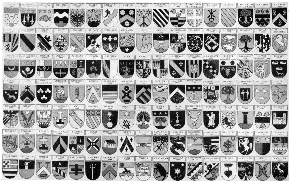
Pl. XVII. — Armoiries des familles reçues citoyennes genevoises de 1792 à 1875. (Suite de la pl. XVI.)