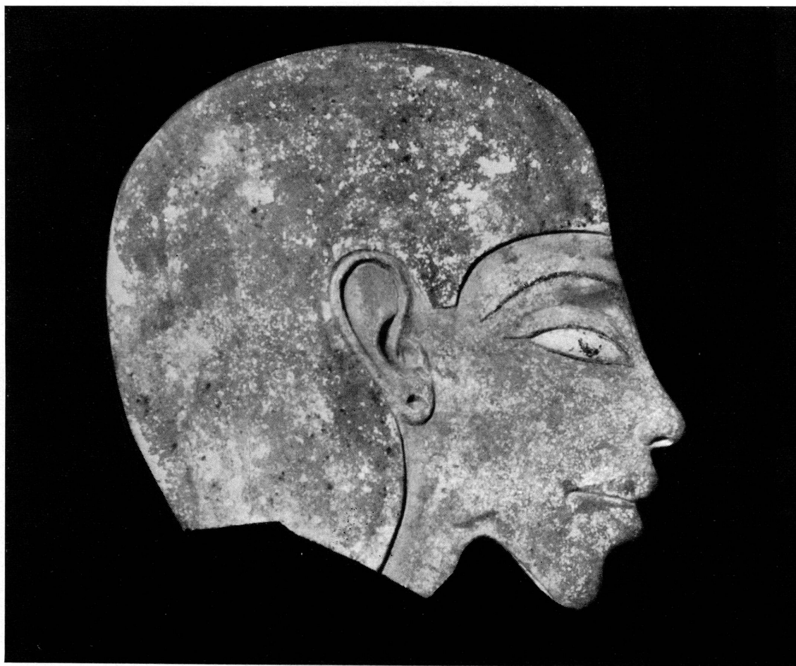
Fig. 110. — Portrait d'homme. Égypte, époque amarnienne.

19492. — Portrait d'homme en calcaire peint découpé. Époque amarnienne. 160 × 140 mm. Voir fig. 110.