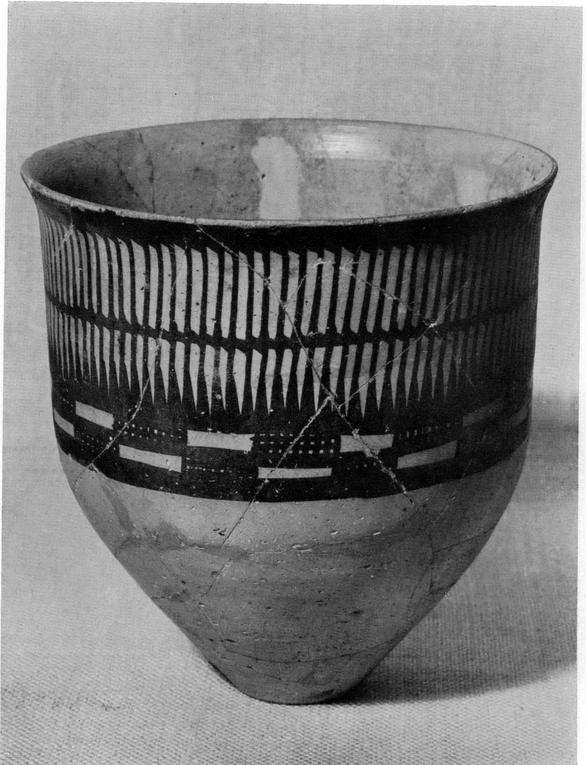
Fig. 113. — Vase peint. Perse, Tépé Sialk.