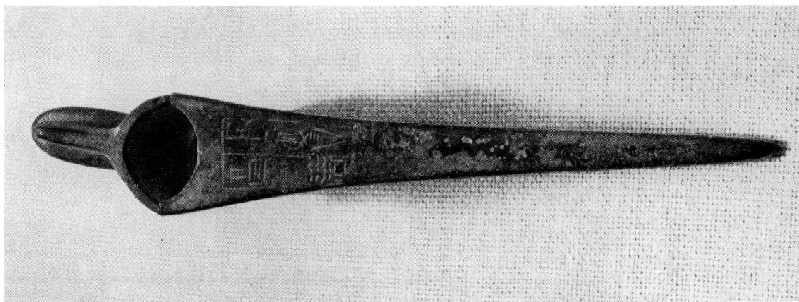
Fig. 111. — Pic avec inscription. Luristan.