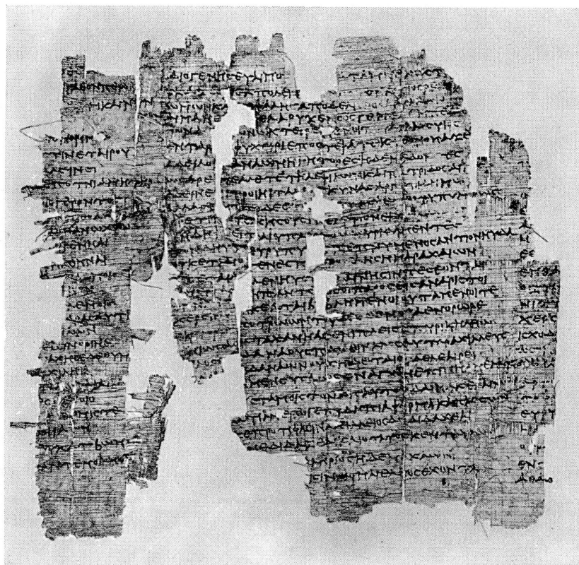
Fig. 22. — Homère. Iliade, chant XI, 788-848 et XII, 1-11. II e siècle avant J.-C. (Papyrus grec, Inv. 90)

De ces innombrables feuilles et rouleaux de papyrus couverts d'écriture grecque beaucoup se sont conservés dans les décombres des agglomérations où leurs rédacteurs habitaient et dont plusieurs ont été au cours du temps abandonnées et recouvertes par le désert.