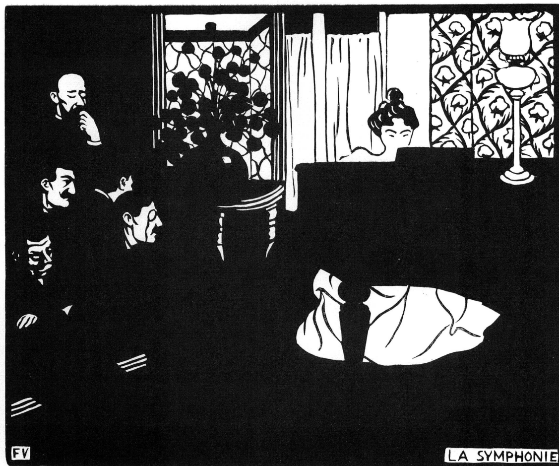
Fig. 4. — F. Vallotton: La symphonie , Bois.