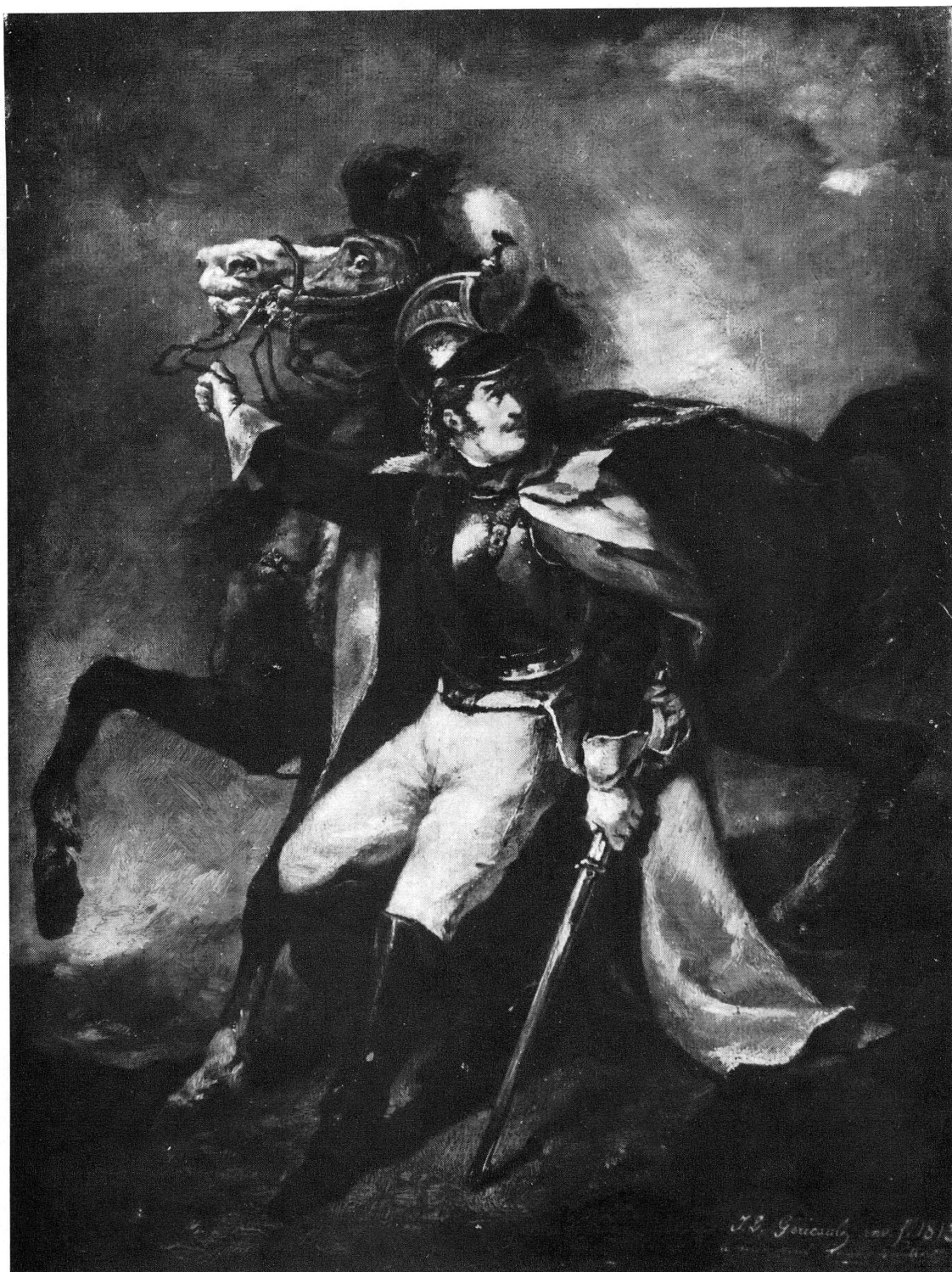
Fig. 2. — Théodore Géricault: Le cuirassier blessé (étude). Huile.