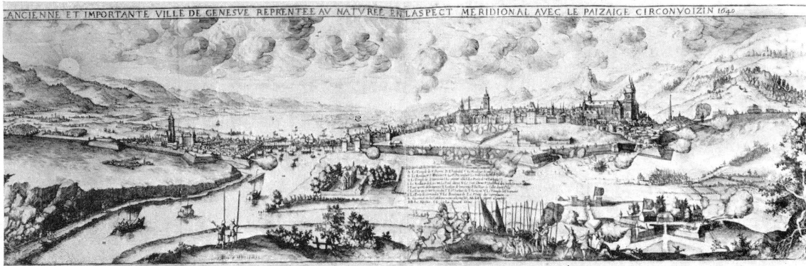
Fig. 2. Vue de Genève par Chastillon, gravée par Poinssart (0,83 × 0,24).

La gravure de Poinssart est signée « A Paris par J. Poinssart ». Le nom de Chastillon n'y figure plus; il a été gratté, mais il en subsiste des traces suffisantes pour le restituer à coup sûr. Qu'est-ce à dire, sinon que l'original a été modifié par le graveur pour en faire – ici, tout le monde est d'accord – une sorte de représentation de l'Escalade, dont l'auteur primitif n'est plus responsable. En résumé, Merian affirme qu'il a reproduit un dessin de Chastillon et Poinssart reconnaît implicitement qu'il a modifié son modèle.