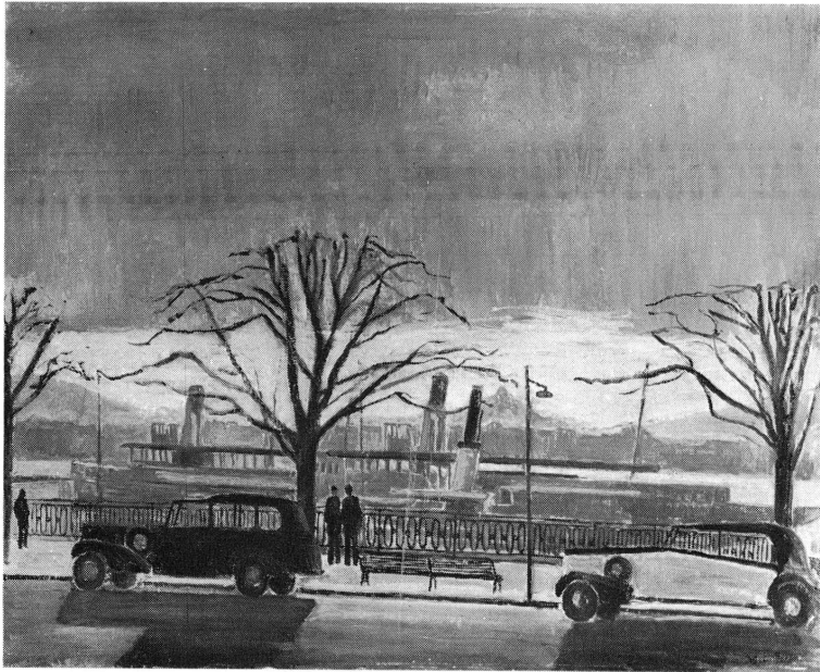
Fig. 37. Le quai du Mont-Blanc (1949).

Le Jardin anglais pavoisé. (Cf. fig. 15.) Huile sur toile. 72,5 × 91,5. Signé en bas à droite: « E. Martin ». Musée d'art et d'histoire, Genève.