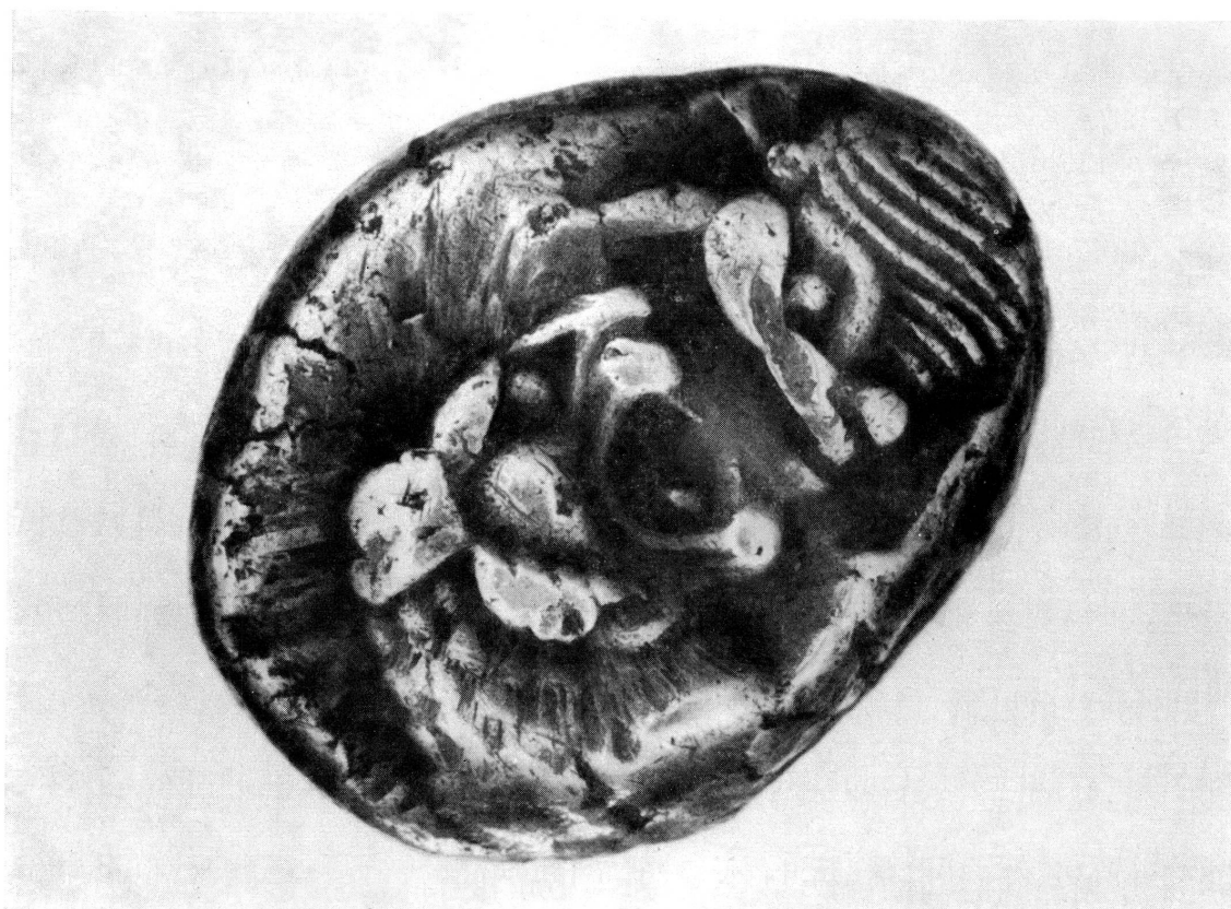
Fig. 2. Lydie Crésus , demi-statère d'argent.

drachme. — Géla: 466-415 avant J.-C., tétradrachme. — Géla: avant 466 avant J.-C., didrachme. — Messine: 480-461 avant J.-C., tétradrachme. — Syracuse: 485-478 avant J.-C., tétradrachme. — Posidonia: 470-400 avant J.-C., statère. — Lydie: Crésus demi-statère d'argent. — Milet: electrum hemi-hècte avec 14 contre-marques. — Lydie: Allyates, eletrum demi-statère. — Thrace: Aenos, 440-412 avant J.-C., tétradrachme. — Agrigente: 550-413 avant J.-C., didrachme. — Crète: Phaestos, 400-360 avant J.-C., Rv. taureau dans une couronne de laurier. — Croton: vers 420 avant J.-C., didrachme. — Dyrrachium (Illyrie): 450-350 avant J.-C., didrachme. — Phocide, guerre sacrée, monnayage fédéral, 357-346 avant J.-C. — Paphlagonie: Sinope, IV e siècle, drachme. — Vélia (Hyélé): 400-268 avant J.-C., didrachme. — Chypre: Zotimos, vers 385 avant J.-C., ville d'Amathonte. — Cilicie: Céléndéris, 400-350 avant J.-C., statère. — Philippe II de Macédoine, 359-336 avant J.-C., tétradrachme. — Les Bruttii: 282-200 avant J.-C., drachme. — Vélia: deuxième guerre punique, drachme. — Péonie: Andoléon, 315-286 avant J.-C., triobol. — Rois de Syrie: Séleucus III, 226-222 avant J.-C., tétradrachme; Antiochus IV, 175-164 avant