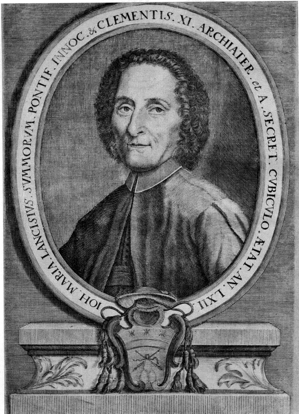
Fig. 8. Giovanni Maria Lancisi (gravure tirée de son Opera , Genevae, sumptibus J.A. Cramer & filii, 1718).