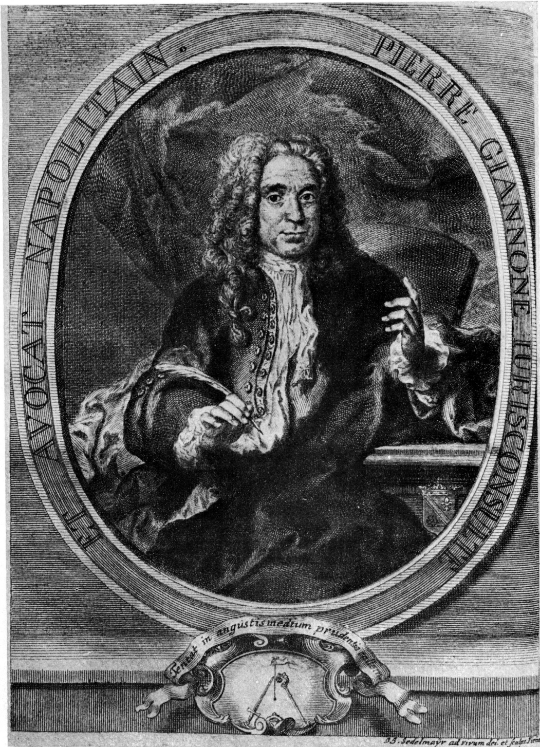
Fig. 3. Pietro Giannone (gravure tirée de son Histoire civile du Royaume de Naples , La Haye [Genève], P. Gosse & I. Beauregard [H.A. Gosse], 1742).