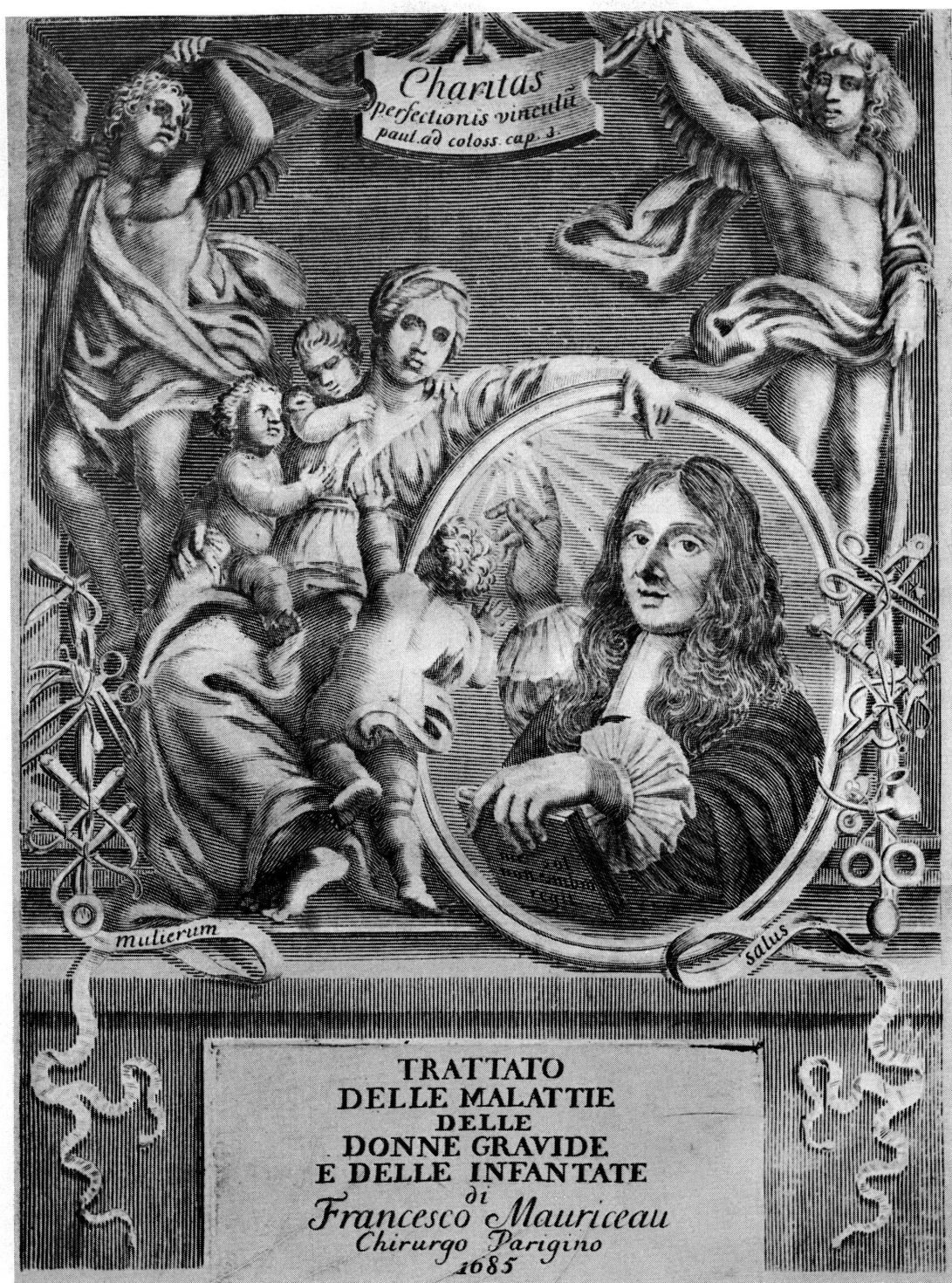
Fig. 6. François Mauriceau (gravure tirée de son Trattato delle malattie delle donne gravide , Cologni [Genève], appresso Gio. Luigi Du Four, 1685).