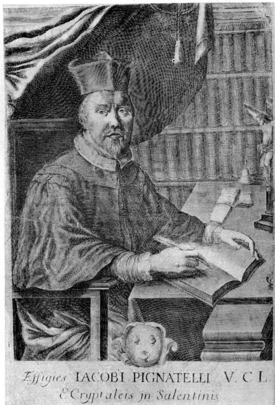
Fig. 4. Giacomo Pignatelli (gravure tirée de son Consultationes canonicae , Coloniae Allobrogum, sumptibus Gabrielis & Samuelis de Tournes, 1700).