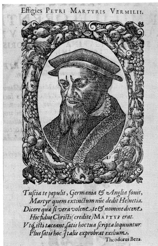
Fig. 1. Pietro Martire Vermigli (gravure tirée de son Loci communes , Genevae, apud Petrum Aubertum, 1624).