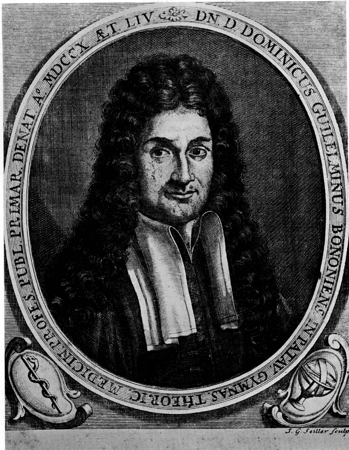
Fig. 10. Domenico Guglielmini (gravure de son Opera omnia, mathematica, hydraulica, medica et physica , Genevae, sumptibus Cramer, Perachon & soc. 1719).