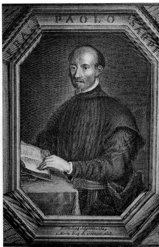
Fig. 2. Fra Paolo Sarpi (gravure tirée de son Historia del Concilio tridentino , Londra [Genève], a spese dei fratelli de Tournes, 1757).

les Alpes est que certains d'entre eux furent réimprimés à plusieurs reprises. Or, il y avait bien une Eglise italienne à Genève, mais le nombre de ses adhérents n'aurait pas justifié à lui seul une telle production typographique, d'autant moins que les réfugiés italiens devaient être à même, après peu de temps, de lire le français. Inversement, les ouvrages italiens et latins édités dans les Etats italiens avaient peu cours à Genève, puisque, pour la plupart, ils étaient entachés de «superstition papistique». Il faut donc admettre qu'en dehors des textes classiques, on ne consommait guère de livres transalpins sur les bords du Léman.