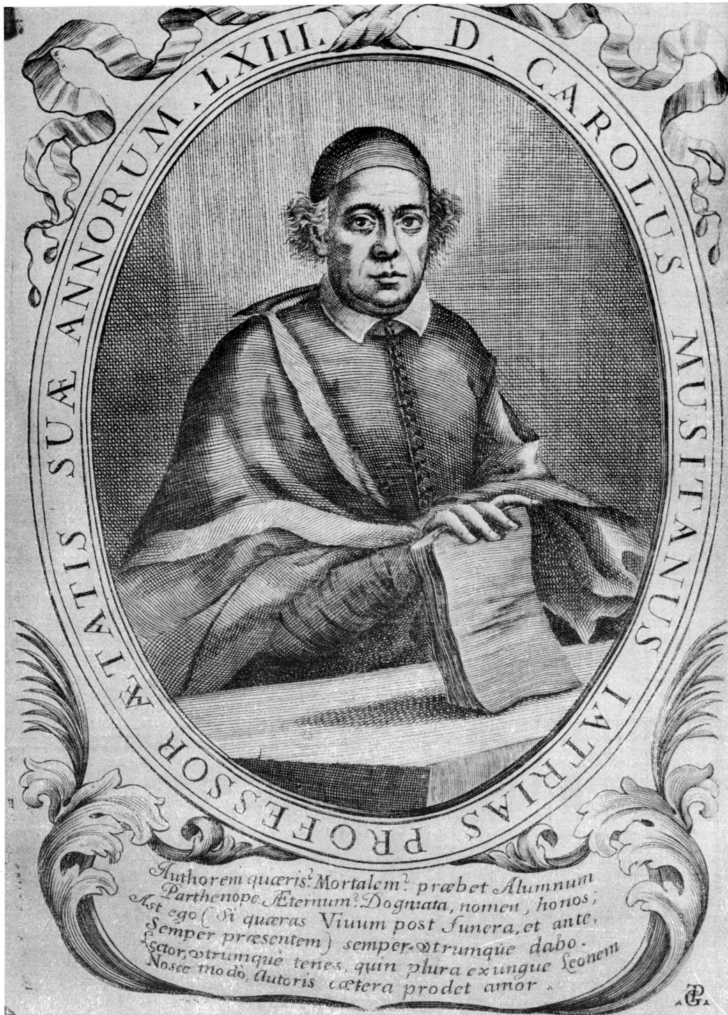
Fig. 7. Carlo Musitano (gravure tirée de son Opera Medica, chymico-practica , Coloniae Allobrogum, sumptibus Chouët, G. de Tournes, Cramer, Perachon, Ritter & S. de Tournes, 1701).