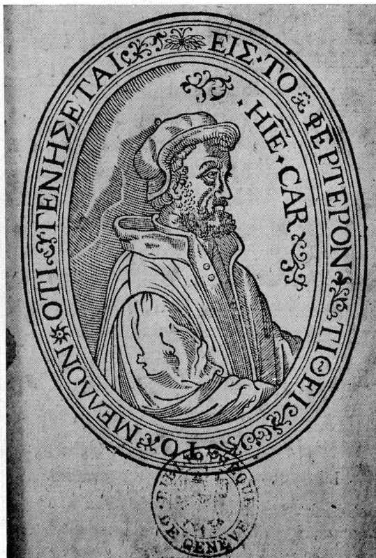
Fig. 5. Gerolamo Cardano (gravure tirée de son De sapientia libri quinque... Aureliopoli [Genève], apud Petrum & Jacobum Chouët, 1624).

Lumières. Ajoutons que, parfois, les presses genevoises recevaient des commandes de la Cour de Sardaigne et qu'il leur incombait d'imprimer pour Turin certaines pièces officielles 40 .