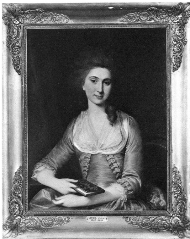
Figure 2. Amélie-Christine Pictet, par Jens Juel (n° 33).

Huile sur toile. 81 sur 66 centimètres. Ni signé ni daté. Selon une inscription ancienne faite à la plume au dos de la toile, il s'agirait du syndic