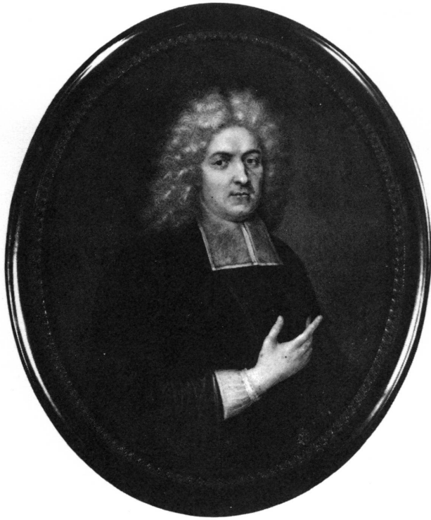
Figure 3. Bénédict Pictet, par les frères Huaut (n° 62).