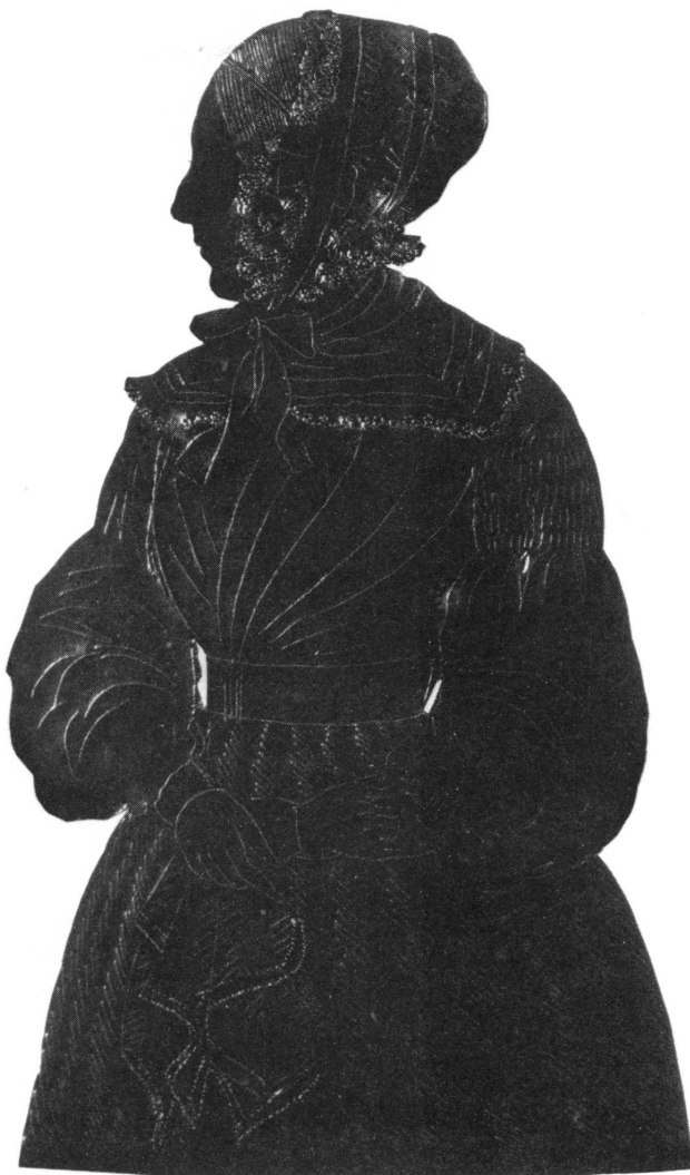
Figure 8. Fanny Pictet (n° 134).

Musée d'art et d'histoire, Genève, Inv. 1918-12.