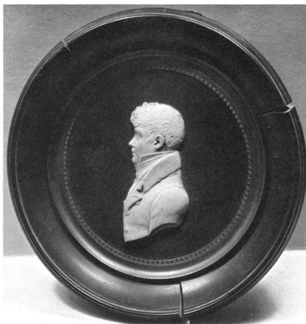
Figure 12. Louis Pictet (n° 234).

238. A l'âge de 74 ans, peu avant son décès, en buste, presque de face, dans son uniforme noir à revers rouges et épaulettes blanches d'officier prussien, décoré de la croix blanche de l'Ordre