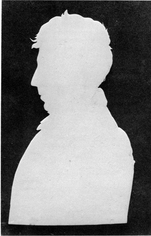
Figure 7. Charles Pictet-de Rochemont (n° 97).

Musée d'art et d'histoire, Genève (déposé à la Bibliothèque publique et universitaire, Département des estampes).