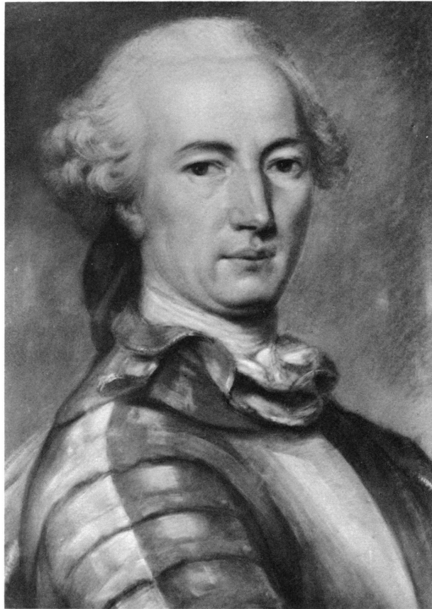
Figure 13. Le colonel Pierre Pictet de Sergy, pastel attribué à J.B. Perronneau (n° 277).

Paru dans: Le Sapajou , no 28, Genève, 18 juin 1896, p. 221.