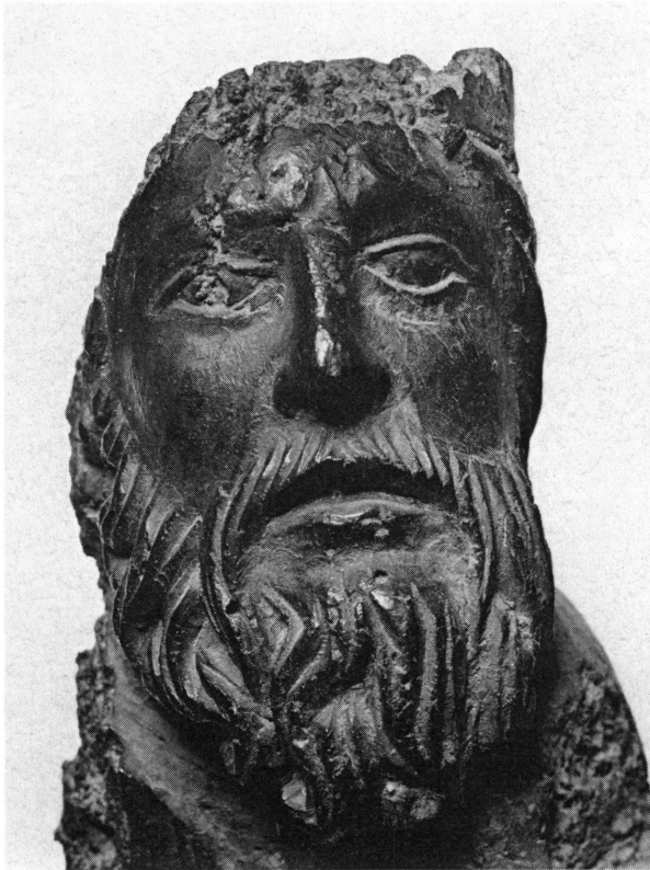
Fig. 4. Vierge de l'Epiphanie, détail de la tête du roi mage, vue de face.