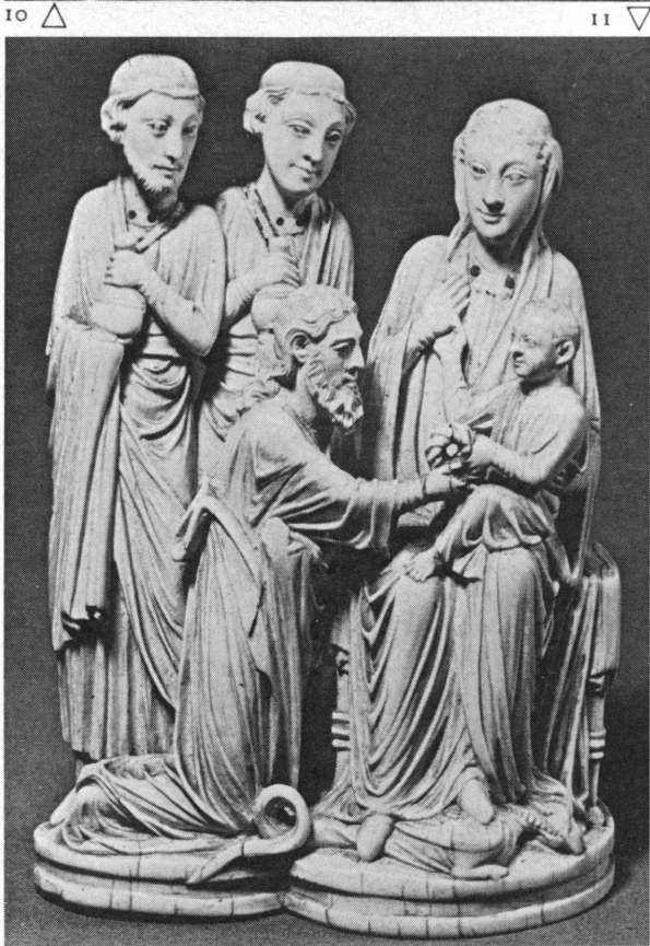
Fig. 11. Copenhague, Musée national, groupe de l'Épiphanie, ivoire, vers 1240-1250.

de l'exécution de la Vierge de l'Épiphanie, nous devons nous contenter d'admirer la simplicité et la rigueur de notre statue. Prise dans une composition sévère, dictée par la courbure de l'énorme tronc d'arbre et une enveloppe générale l'inscrivant dans un arc brisé, la Vierge trône et domine ses compagnons dont les têtes s'étagent autour d'elle: le visage de l'Enfant se situe à hauteur de l'épaule de la Vierge; celui du mage à hauteur du coude. L'Enfant regarde le roi et celui-ci lève ses yeux vers lui, tandis que la Vierge semble laisser planer son regard au loin, fixant les fidèles rassemblés devant elle. Cette double relation Enfant et roi, Vierge et nous, spectateurs, introduit une dimension psychologique peu fréquente dans l'art du XIII e siècle.