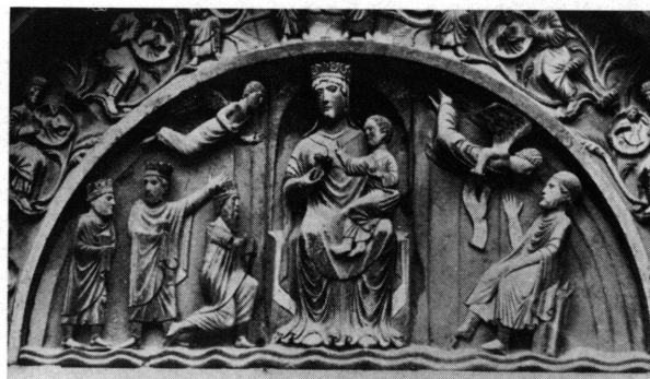
Fig. 7. Parme, baptistère, tympan, peu après 1196.

l'Épiphanie au XIII e siècle. Pour autant qu'il soit permis de tirer des conclusions, malgré le très petit nombre de statues françaises du XIII e siècle, en bois, parvenues jusqu'à nous (ou tout au moins publiées), celle-ci est la seule qui, ayant fait partie d'un groupe de l'Épiphanie, en a conservé des traces indiscutables.