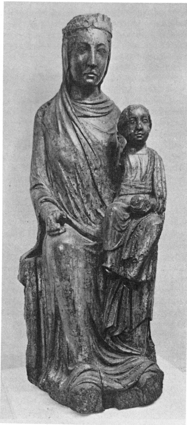
Fig. 12. Namur, Musée diocésain, Vierge à l'Enfant provenant de Cens, vers 1220-1230.