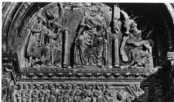
Fig. 6. Saint-Gilles-du-Gard, tympan de la porte gauche, vers 170 (?).