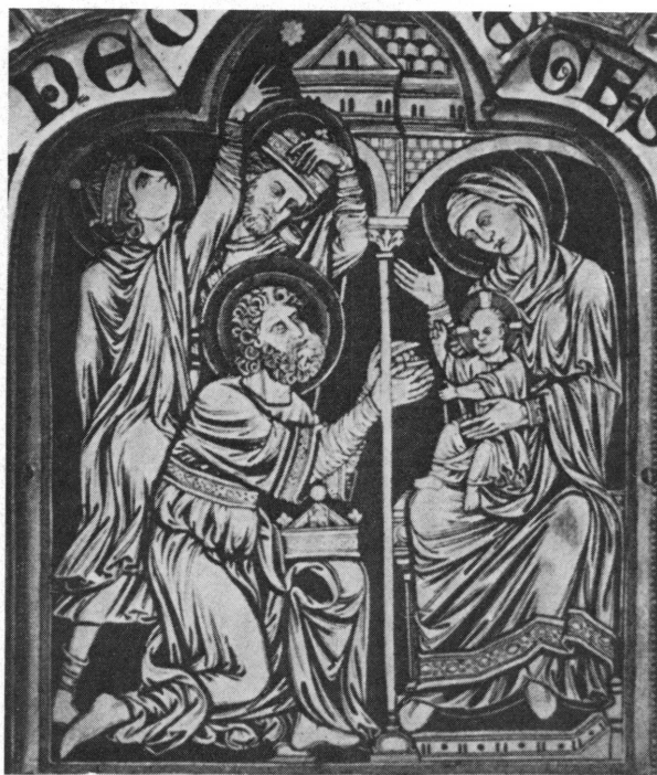
Fig. 10. Klosterneuburg, détail du retable exécuté par Nicolas de Verdun en 1181.