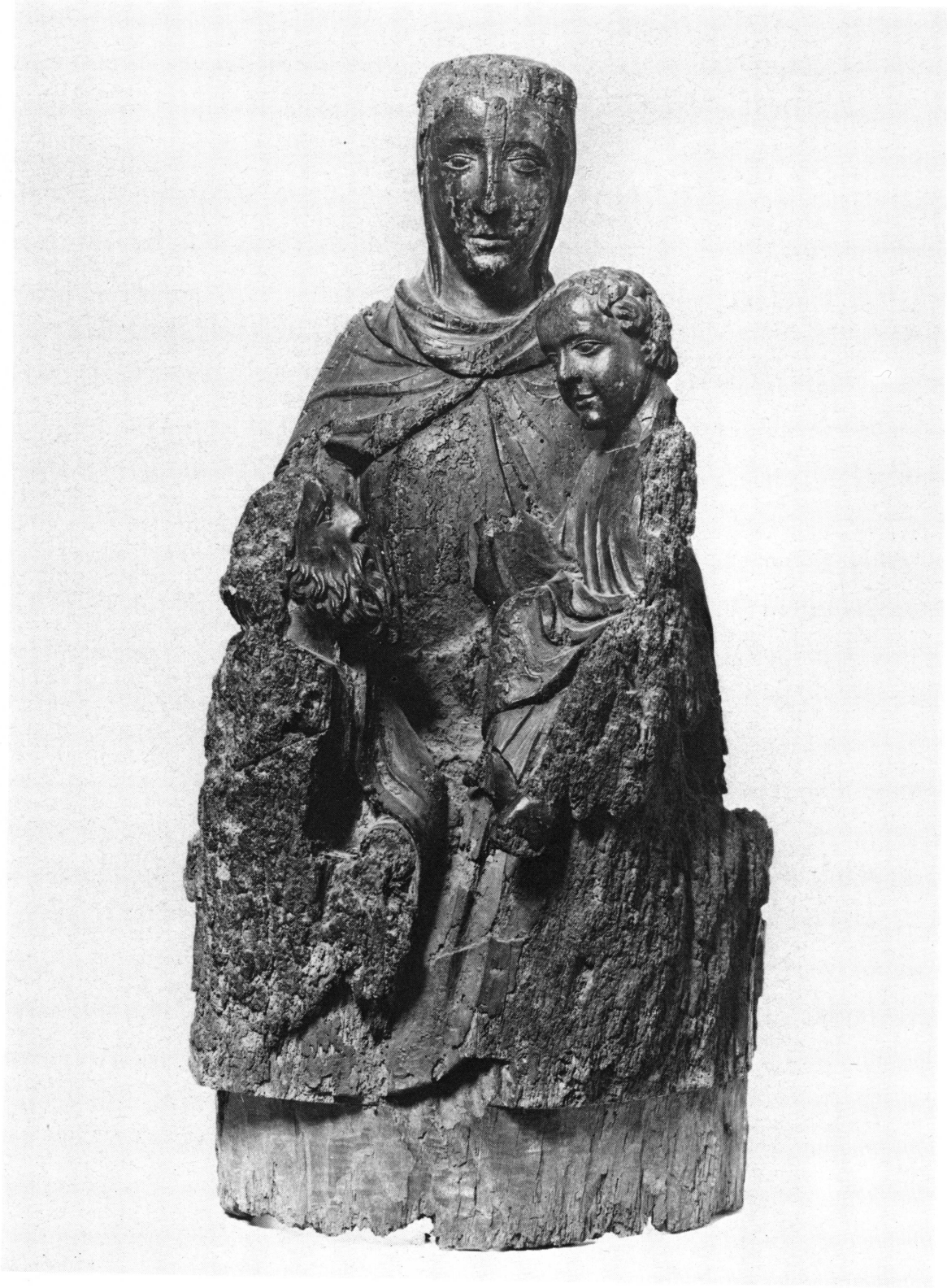
Fig. 3. Vierge de l'Épiphanie, vue de face.