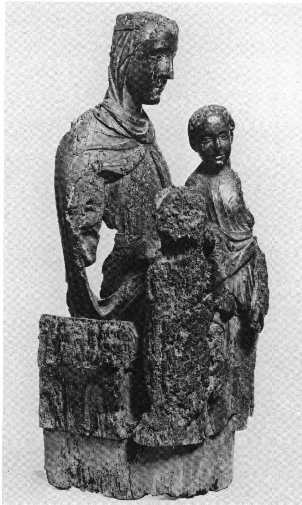
Fig. 1. Vierge de l'Epiphanie, vue de trois quarts à gauche.