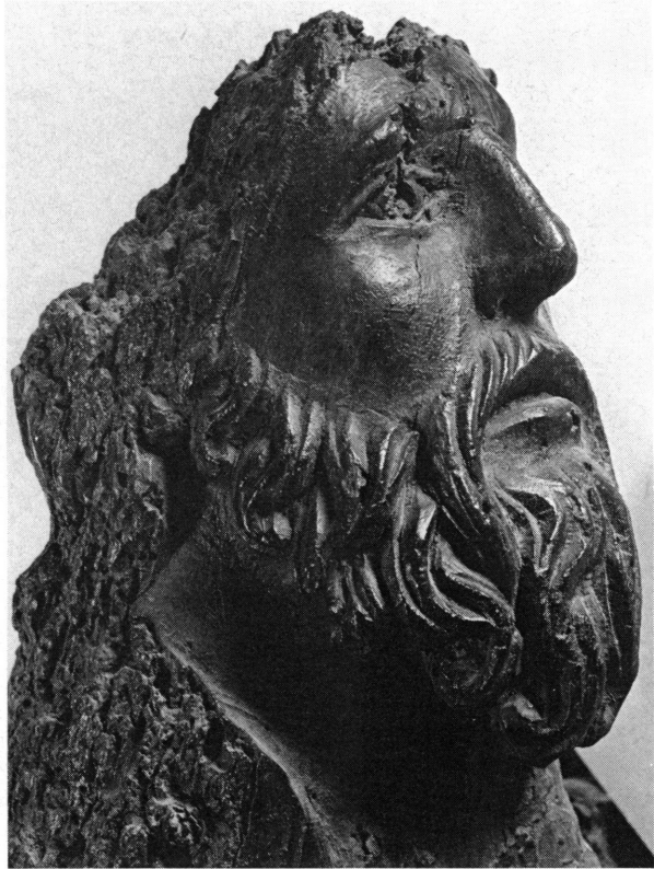
Fig. 5. Vierge de l'Epiphanie, détail de la tête du roi mage, vue de profil.

l'Adoration (vers 1230/1240). On sait que le jubé ne nous est parvenu que sous la forme de fragments; celui de l'Epiphanie, très mutilé, est rarement reproduit 5 . On distingue pourtant la Vierge assise, tenant l'Enfant sur ses genoux. Le roi agenouillé s'approche d'elle au point de presque toucher de son pied gauche celui de la Vierge 6 : mais entre les deux personnages reste un grand vide qui exprime toute la distance entre la Majesté divine et les fidèles. L'Epiphanie du jubé chartrain renoue avec la tradition qui avait dicté aussi bien l'iconographie romane de Saint-Gilles, ou gothique de Laon, que les miniatures comme celles du Psautier d'Ingeburge (vers 1195) ou les émaux du «retable» de Klosterneuburg exécutés par maître Nicolas de Verdun en 1181 7 (fig. 10). S'il était possible que la face représentant l'Epiphanie de la chasse de N.-D. de Tournai, créée par Nicolas de Verdun en 1205, ne soit