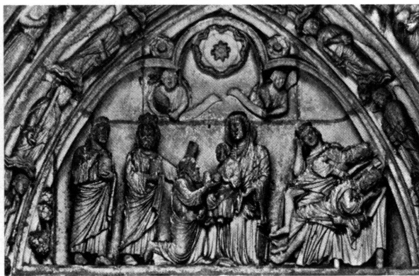
Fig. 9. Chartres, cathédrale, tympan de la porte de gauche du transept nord, vers 1220.

Nous n'avons pas insisté sur les critères stylistiques qui permettent de dater et de localiser la Vierge de l'Épiphanie nouvellement entrée au Musée de Genève. Pour le faire, il aurait fallu disposer d'une meilleure information sur la statuaire française en bois du XIII e siècle. Les comparaisons avec la statuaire des grandes cathédrales permettent certes de déterminer une chronologie relative (d'où notre proposition «vers 1230», entre l'époque du transept nord de Chartres et de la façade d'Amiens), mais n'autorisent que de vagues localisations