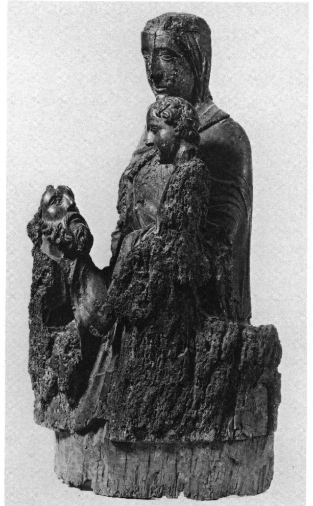
Fig. 2. Vierge de l'Epiphanie, vue de trois quarts à droite.

et le plus âgé des rois mages, agenouillé. Deux autres statues figuraient les autres rois venus adorer l'Enfant et lui offrir des présents. Le groupe central étant sculpté dans une pièce de bois entièrement évidée dans le dos, celui-ci devait avoir été conçu non comme une ronde-bosse, mais comme une statue adossée à une paroi. Les deux rois mages debout étaient soit sculptés en ronde-bosse et placés sur des socles individuels, soit évidés eux-aussi dans le dos et groupés sur un seul socle. Des Epiphanies en bois de la fin du xiv e et du xv e siècles fournissent des exemples de l'une et l'autre possibilités. La façon dont le bois de notre groupe