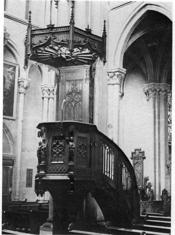
Fig. 5. La chaire fut sculptée, ainsi que le grand Christ en croix et les stalles, par un artiste local, M. Jeunet. Son abat-son s'inspire de celui de la cathédrale Saint-Pierre.

Comme le remarquait un éminent spécialiste suisse, ils constituent la plus remarquable série de cette époque en Suisse et peut-être en Europe.