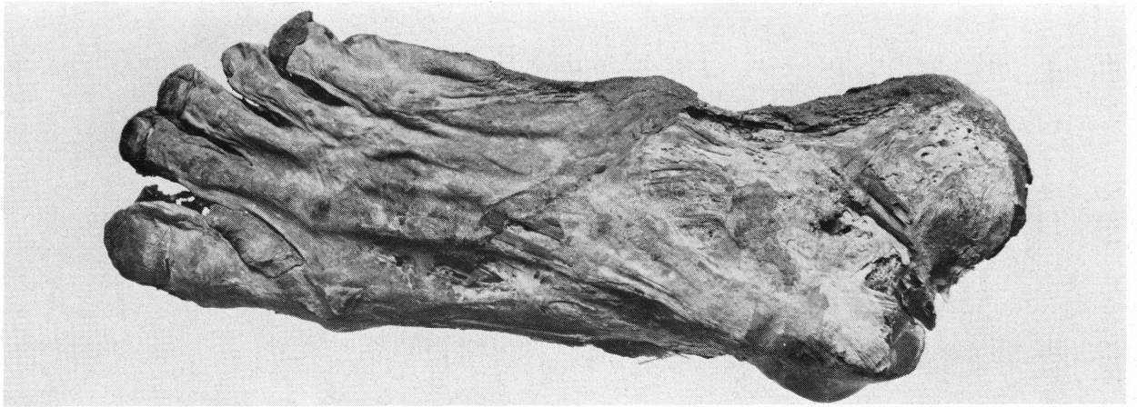
Fig. 2. Pied gauche féminin momifié naturellement. Tombe 40 (éch. 1/2).