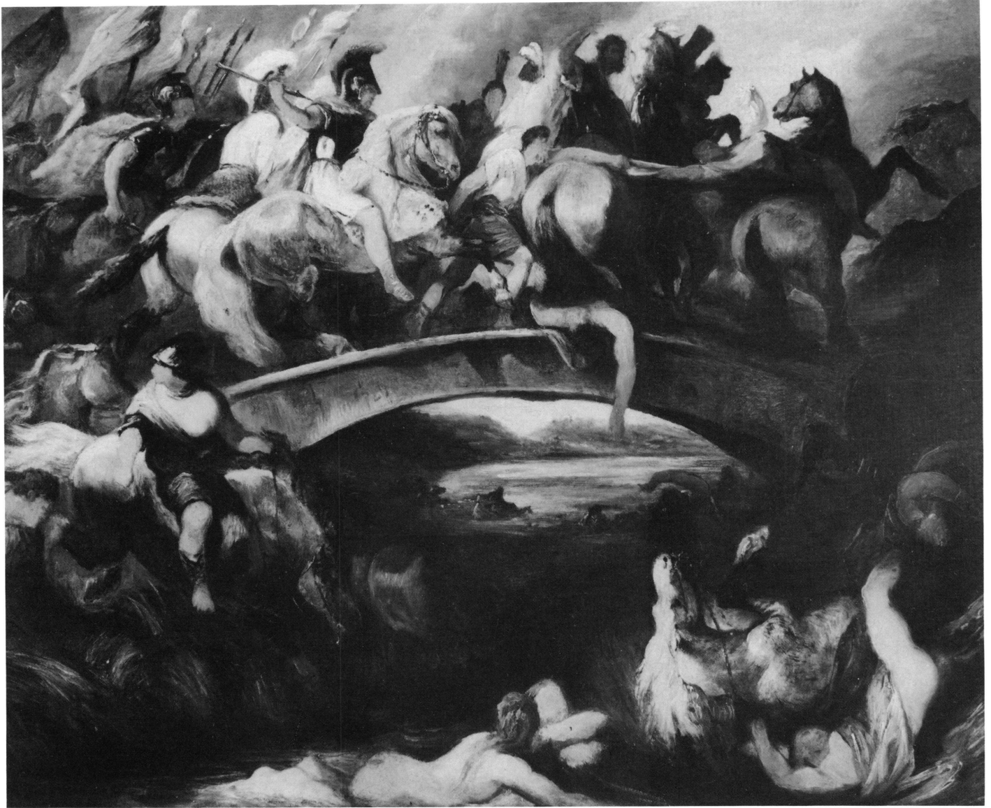
6. Edouard Odier, La Bataille des Amazones , copie d'après Rubens. Modène, Galerie Campori (musée communal).