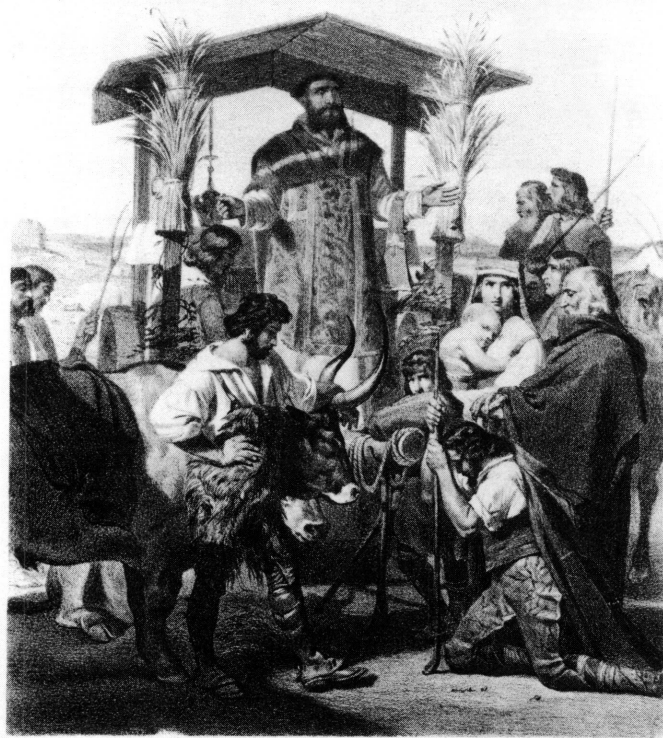
La Messe pendant la moisson dans la campagne de Rome.

10 Pour compléter l'article de Marcel Roethlisberger, donnons la reproduction d'une lithographie d'époque par Henri Baron (éditée chez Chalmel et imprimée chez Bertauts) qui garde ainsi le souvenir du tableau d'Anancy apparemment disparu (fig. 7). C'était le n° 1376 du Salon de