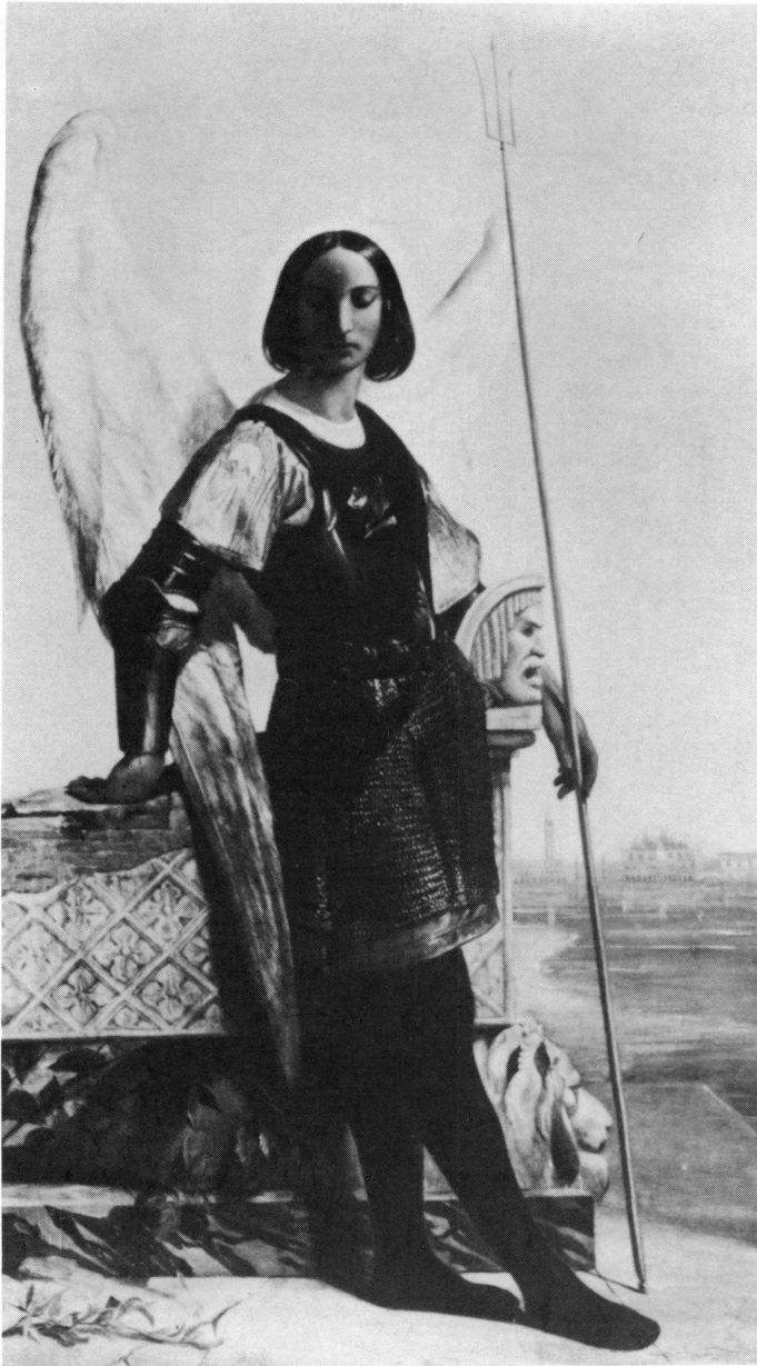
2. Edouard Odier, Le Génie de Venise sur les ruines de sa ville , Salon de 1837. Shepherd Gallery, New York (en 1980).