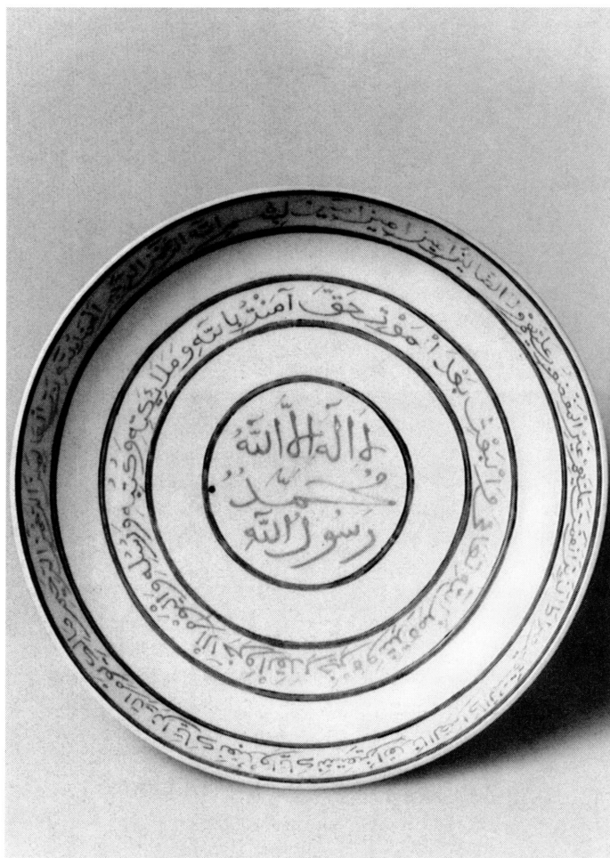
1. Avers du plat de porcelaine chinoise à décor ottoman. Haut. 3,8 cm. Diam. 22 cm. Inv. AR 8699.

avec ce commentaire : « où sont placées exclusivement des porcelaines provenant de l'Extrême-Orient, ainsi que quelques spécimens persans et arabes ». L'auteur du catalogue paraît avoir considéré le plat qui nous intéresse