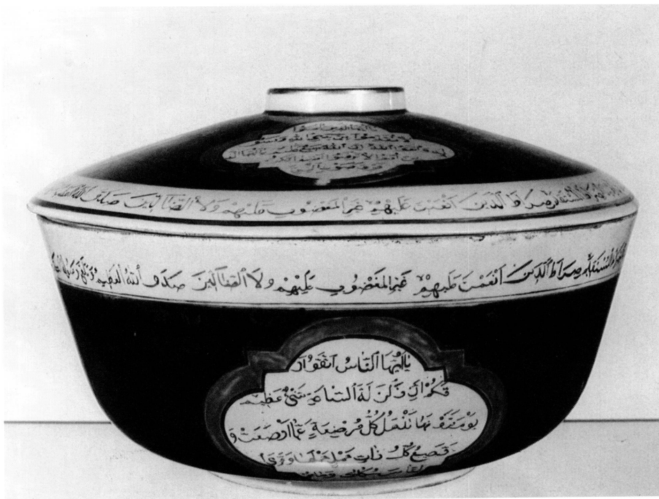
6. Terrine en porcelaine chinoise à décor ottoman. Bruxelles, Musées royaux d'Art et d'Histoire. Inv. E.O. 2545.