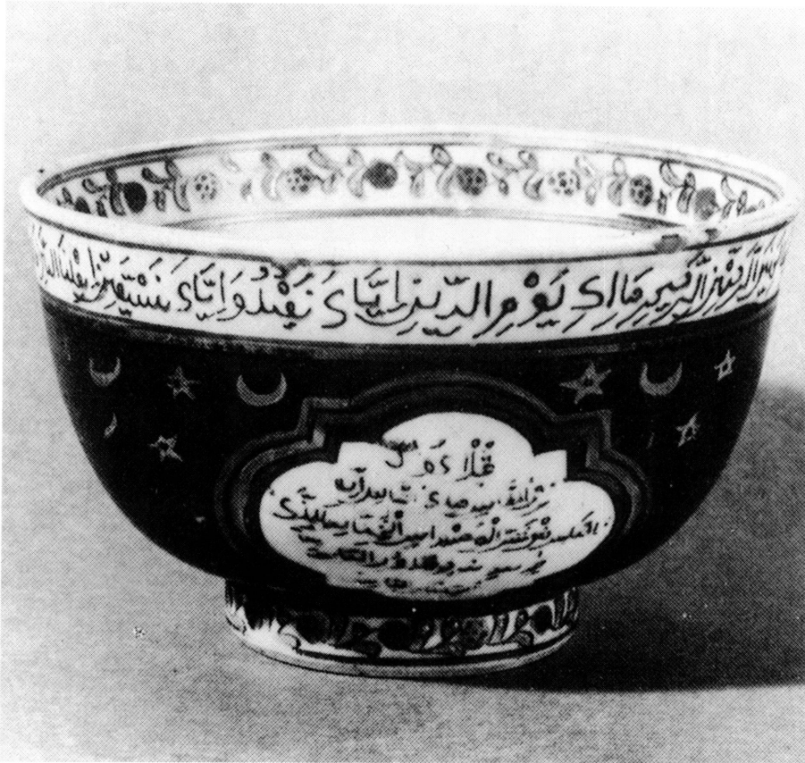
8. Tasse en porcelaine chinoise à décor ottoman. Haut. 7,8 cm. Diam. 5 cm. Anciennement collection Fr. Duchêne, Paris.

Concernant la calligraphie elle-même, il vaut la peine de rappeler que des inscriptions en caractères arabes étaient souvent exécutées en Chine, avec plus ou moins d'habileté il est vrai. On pense, par exemple, à la céramique dite de Swatow destinée au marché du Sud-Est asiatique et souvent décorée de textes coraniques. Or sur ce type d'objets, la lecture des inscriptions est souvent difficile, les textes étant parfois estropiés ou tronqués comme si les calligraphes chinois n'avaient pas vraiment compris ce qu'ils écrivaient 15 . Mais on connaît aussi des pièces d'exécution beaucoup plus soignée, faites probablement pour des musulmans résidant en Chine, peut-être même dans l'entourage de l'Empereur. Ainsi ce plat de l'époque Ming portant la marque de règne - le nien bao - de Zengde (1506-1521) transcrit phonétiquement en caractères arabes 16 .