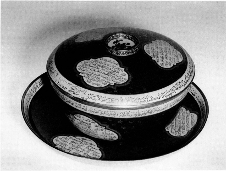
5. Terrine en porcelaine chinoise à décor ottoman, avec son présentoir. Haut. 18,9 cm. Diam. 30,05 cm ; présentoir diam. 45 cm. Paris, Musée Guimet, Inv. G 2688.