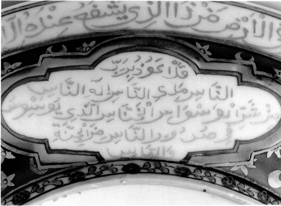
2. Détail du revers du plat AR 8699. Réserve contenant la sourate 113.

comme l'un de ces « spécimens arabes », comme le confirme le texte du catalogue de 1905 où cette pièce est désormais classée sous « Porcelaines persanes » 1 .