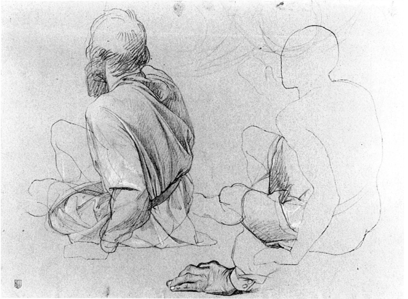
2. Jean-Léonard Lugardon, Etude pour la figure d'Henri de Melchtal , vers 1840. Plume et encre brune, mine de plomb, rehauts de craie blanche sur papier bleuté. 27,9 x 38 cm. Genève, Musée d'art et d'histoire, Cabinet des dessins, inv. 1912-24/59.

tion à partir du modèle d'académie : « greffées » sur le corps d'un jeune homme, une barbe rapidement crayonnée et une main ridée annoncent Henri de Melchtal (fig. 2). Mais les figures ne sont pas l'unique objet des soins de l'artiste : deux petites huiles et deux dessins témoignent d'une véritable recherche d'expression pour les bœufs 10 (fig. 3).