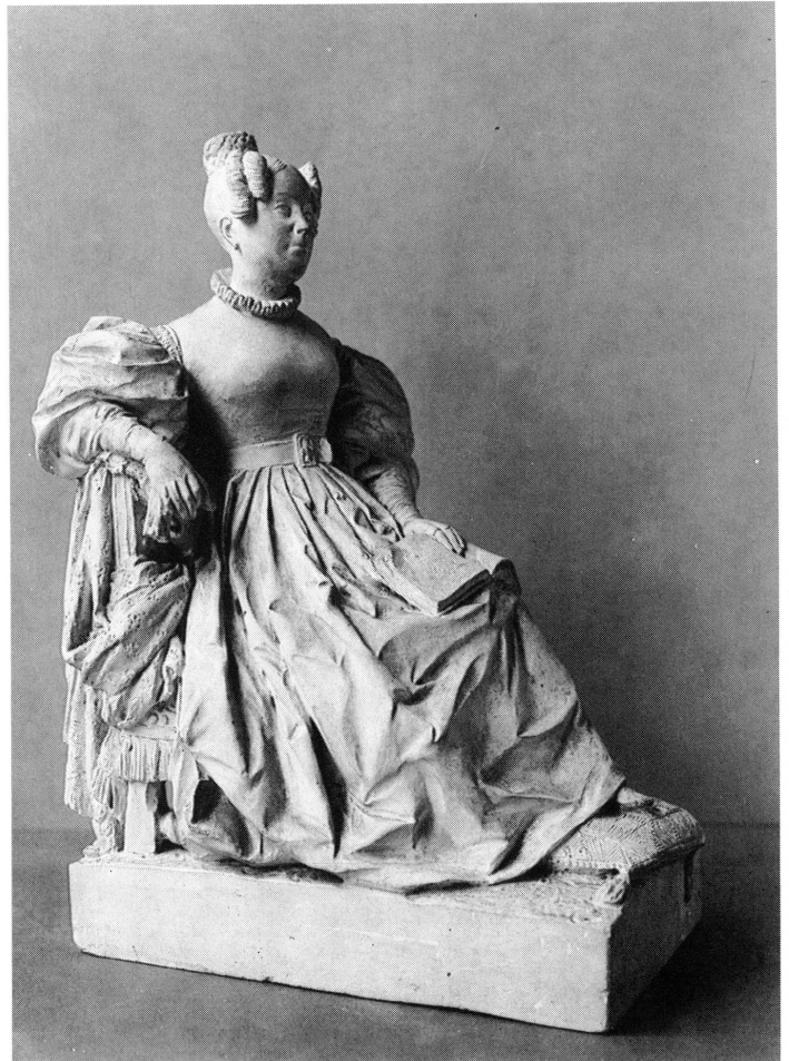
1. John-Etienne Chaponnière, Femme assise , plâtre, 32.5 cm, signé et daté sur le socle : J.E. CHAPONNIERE, 1835. Paris, Musée des arts décoratifs, inv. 28.123.

Ces deux dernières sculptures sont envoyées à Genève pour l'exposition du Musée Rath de 1829 11 . Mais, à l'exception du bas-relief allégorique, Chaponnière, de retour