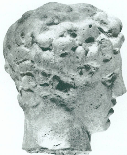
2. Tête d'éphèbe. Face, profil. Terre cuite composée de 3 moules. Argile very pale brown 8/4-10yr. Traces d'engobe jaunâtre. Haut. 3,5 cm. Smyrne. Epoque hellénistique. Genève, Musée d'art et d'histoire, Inv. 10995.

Si la production de Myrina est le reflet de Praxitèle, le génie de Lysippe de Sicyone 14 marque celle de Smyrne. De ce sculpteur bronzier qui œuvra à la cour de Philippe de Macédoine, reçut commande du portrait d'Alexandre le Grand et pratiqua son art dans tout le monde grec, nous ne connaissons le génie qu'à travers des copies romaines, des monnaies, des sources littéraires et épigraphiques et enfin... des terres cuites.