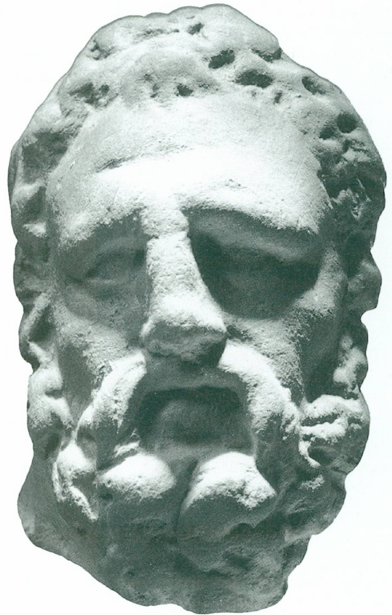
1. Tête d'Héraclès. Terre cuite composée de 3 moules. Argile light brown 6/4-7.5yr. Haut. 3,8 cm. Smyrne. Epoque hellénistique. Genève, Musée d'art et d'histoire, Inv. 11097.

Au IV e siècle, les rapports entre la petite plastique et la grande sculpture semblent devenus si primordiaux qu'il est nécessaire, dès qu'on est en présence d'un type nouveau, d'en chercher l'original sculpté et de ne pas croire, parce qu'on ne l'a pas trouvé, qu'il n'a pas existé. Concernant les plus fameuses créations de l'art classique, toutes les grandes collections de figurines provenant de Smyrne ont révélé des trésors. Une figurine du Metropolitan Museum de New York représentant le Diadumène de Polyclète 10 est une merveille de précision. Nul doute que l'artiste a dû avoir sous les yeux, sinon l'original, du moins une réplique, pour réaliser une copie aussi fidèle. Et ce n'est pas là un cas isolé! Du même créateur, le musée de Copenhague 11 conserve une tête d'éphèbe d'après le Doryphore, et le musée de Leyde est l'heureux possesseur d'un splendide «Eros de Thespies ou Eros à l'arc» d'après Lysippe 12 . De nombreux