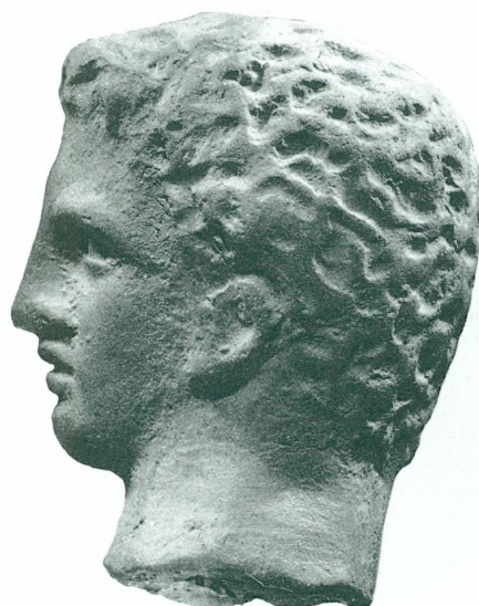
3. Tête d'éphèbe. Terre cuite composée de 3 moules. Argile light brown 6/4-7.5yr. Haut. 4 cm. Smyrne. Epoque hellénistique. Genève, Musée d'art et d'histoire, Inv. 10960.

mineure! La maîtrise de la technique, surtout lorsqu'elle réinvente le modèle, génère aussi l'art, et ce n'est pas l'étymologie qui nous contredira: technique, du grec tekhnê , art.