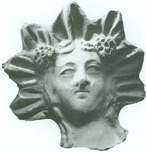
6. Tête de Dionysos. Couronnée d'un diadème composé de sept feuilles de lierre stylisées. Terre cuite dont seule la face est moulée. Revers sommaire. Argile very pale brown 7/4-10yr. Haut. 5 cm. Smyrne. Epoque hellénistique ou romaine. Genève, Musée d'art et d'histoire, Inv. 11106.