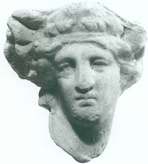
7. Tête de Dionysos. Terre cuite composée de 3 moules. Argile reddish yellow 7/6-7.5yr. Haut. 4,7 cm. Smyrne. Epoque hellénistique. Genève, Musée d'art et d'histoire, Inv. 10982.

formes. Entre le Nil et la Mer Rouge, sur le chemin emprunté par des hommes du voyage, les roches portent encore des dédicaces au dieu Pan, celui «qui montre la bonne route» ou «qui procure de l'or». Assimilé à Min l'Egyptien, le vieux dieu pastoral des Grecs poursuit dans le désert, comme au cœur des forêts d'oliviers, sa mission de protection et de réconfort. Cependant que dans les cités bruisantes, on honore les souverains tels les dieux qu'ils personnifient, Alexandre le Grand comme Zeus-Ammon, Arsinoë comme Aphrodite, ailleurs c'est pour interroger une prophétesse que l'on se rend dans un des nombreux sanctuaires d'Apollon, le dieu oraculaire par excellence, à moins que l'on ne sacrifie à l'un de ces cultes à mystère qui fleurissent à l'époque, notamment ceux de Déméter et de Dionysos.