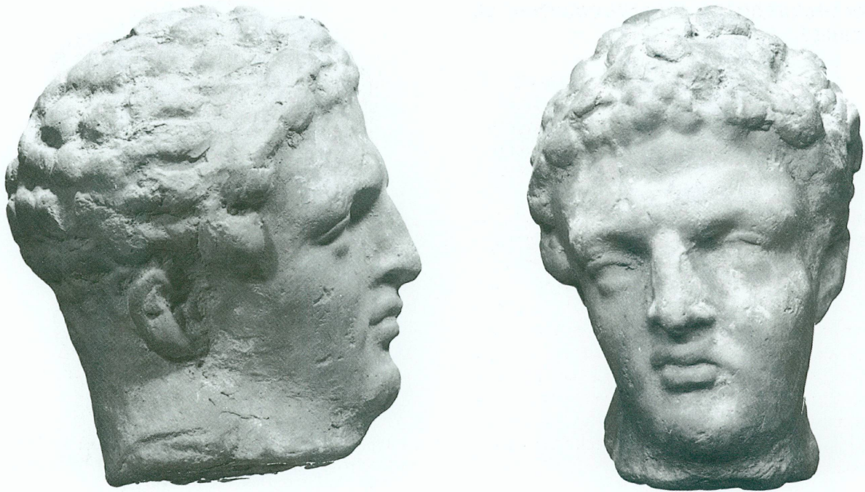
4. Tête d'homme. Face et profil. Terre cuite composée de 3 moules. Argile reddish yellow 7/6-7/5yr. Traces d'engobe blanc. Haut. 4,6 cm. Smyrne. Epoque hellénistique. Genève, Musée d'art et d'histoire, Inv. 11103.

Arrêtons-nous enfin sur une belle tête d'homme (fig. 4), qui, bien que plus proche du portrait que les deux figures précédentes, garde encore l'anonymat. Le profil est mou, le cou empâté et le double menton accusent l'âge déjà mûr du personnage. Cependant, le visage à la bouche charnue et au nez légèrement aquilin ne manque pas de force. La tête est inclinée sur la droite et le regard semble perdu dans une grave réflexion. L'artiste s'est-il inspiré de l'Apoxyomène de Lysippe ou davantage du lutteur de schéma polyclétéen? On pourrait préférer mettre l'accent sur une grande proximité d'expression avec un portrait en pied du Louvre 19 , identifié par Jean Charbonneaux 20 comme représentant le souverain séleucide Alexandre I er Balas (151-147 av. J.-C.), et où se mêleraient des emprunts au répertoire de Lysippe et de Scopas. Il faudrait distinguer ce qui participe, d'une part, du portrait fidèle du souverain, d'autre part, de l'emprunt au répertoire classique, pour pouvoir dater notre figurine à partir de la deuxième moitié du II e siècle avant J.-C.