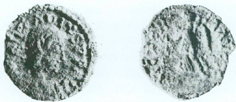
2. M 914, Arcadius, 383-408, Lyon ou Arles ou Siscia, 383-402, Æ 4 Av.: [DN] ARCADIVS PF AVG; buste drapé diadémé à droite Rv.: VICTOR—IA AV[GGG]; Victoire passant à gauche tenant couronne et rameau Æ, 0,862 g, 14,1/13,6 mm, 360°

En conclusion, sur la base du critère adopté, on retiendra que les fouilles Saint-Pierre 1995 nous ont livré du matériel numismatique qui ne dépasse pas 455 de notre ère. Il est en outre chronologiquement d'une extrême cohérence, devant être placé, dans sa presque totalité, entre 383 et les premières années du V e siècle.