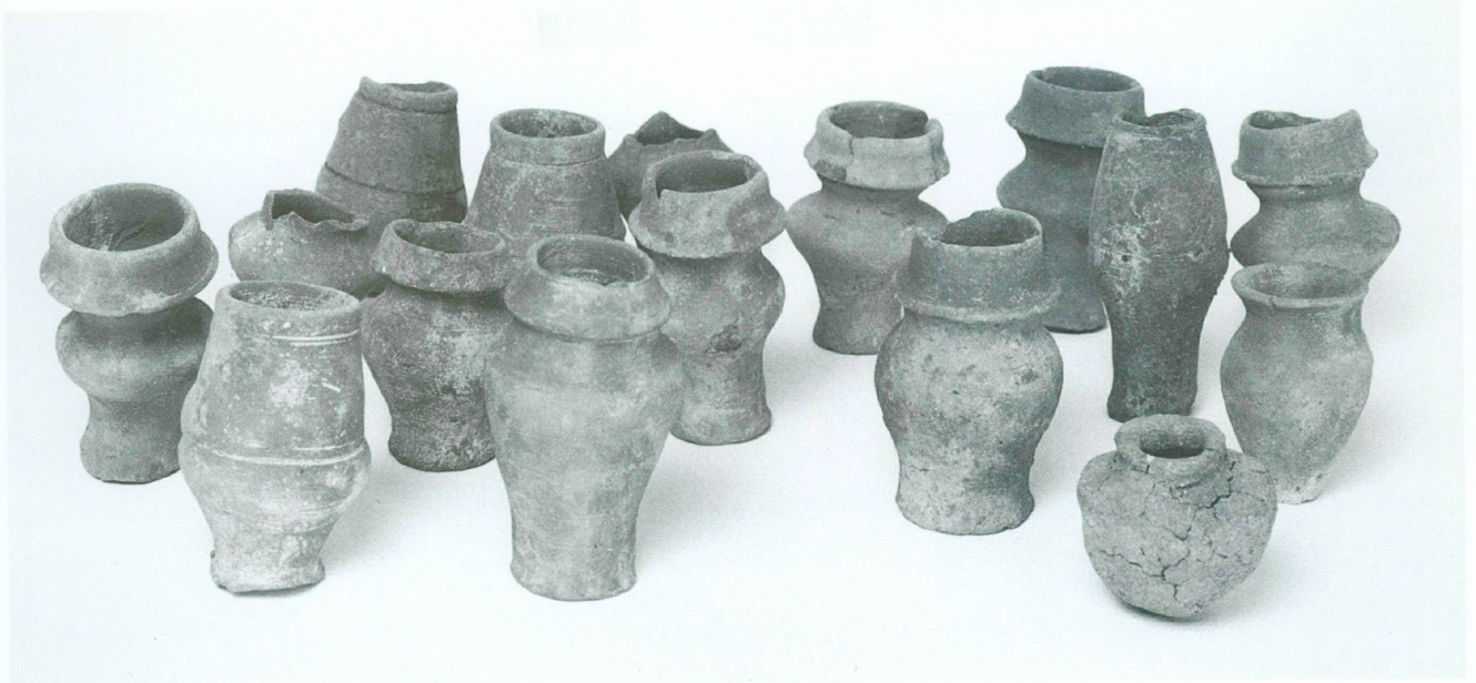
2. Exemples de vases miniatures (1996)

Deux indices pourraient expliquer une telle présence à cet endroit. D'une part, l'éperon d'Abu Rawash, qui culmine à une altitude de plus de 160 m, dominait un carrefour d'anciennes voies de communication, partant de la vallée du Nil en direction du désert occidental, vers le Ouadi Natrun et le Fayoum. Or, ce secteur de constructions offre, au nord-est de la pyramide, un panorama unique, avec une vision circulaire à partir du plateau de Gîza, au sud-ouest, jusqu'à l'arrivée du Ouadi Qaren, au nord-ouest. D'autre part, il est connu que la chaussée d'accès septentrionale a facilité, jusqu'au XIX e siècle, l'exploitation du complexe funéraire comme carrière de granite et de calcaire. Compte tenu de ces observations, la construction quadrangulaire édifîée au nord-est de la pyramide pourrait rappeler les castella romains et, plus particulièrement, les bâtisses du désert oriental. Des études récentes ont montré que ces fortins, de dimensions et de plans variés, ne sont pas systématiquement dotés de tours internes ou externes, que leur construction, souvent réalisée en pierre, pouvait également inclure des structures internes en briques crues, pour des casernements d'environ 5,00 x 4,00 m 3 . Une telle construction à Abu Rawash ne saurait, actuellement, être complètement écartée, d'autant que la destination de ces fortins visait précisément à permettre le trafic commercial et à assurer la sécurité autour des exploitations de mines et carrières du désert oriental.