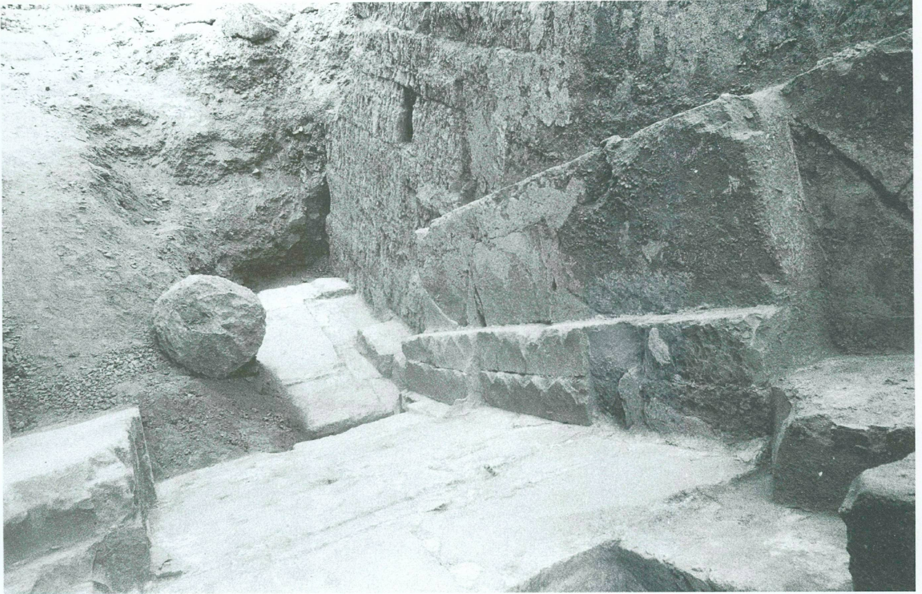
6. Vue sur l'extrémité sud de la descenderie et son retour horizontal, en direction de sa jonction avec le puits funéraire (1996)