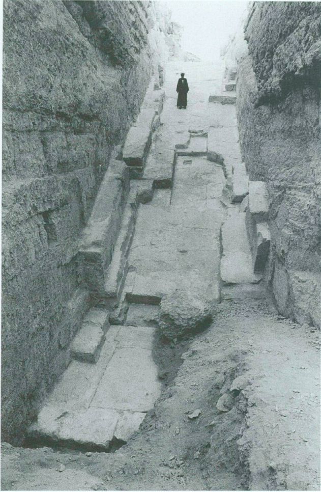
5. Vue sur la descenderie dégagée, à la fin de la deuxième campagne (1996)

(0,30 x 0,25 m) présent dans la paroi occidentale, à la cote 160,00 m (fig. 3). Ce pertuis, vraisemblablement destiné à un repère, situé environ 1,50 m au-dessus du sol d'usage, indiquait l'aplomb de l'extrémité méridionale de l'excavation. Or, son éloignement horizontal par rapport à l'origine de la pente de la descenderie correspond au double de sa hauteur, soit la valeur \frac{1}{2} de la tangente de 28^\circ . Cette pente correspond bien, elle aussi, à celles des dispositifs construits dans les pyramides de Snefrou à Meïdoum et à Dahchour-Nord, mesurés à 27^\circ 56' . Si, enfin, le niveau de sol a été correctement situé à son point inférieur, l'entrée de la descenderie elle-même devait se trouver à l'altitude du parement, à une hauteur d'environ 8,30 m au-dessus du sol ancien (fig. 3).