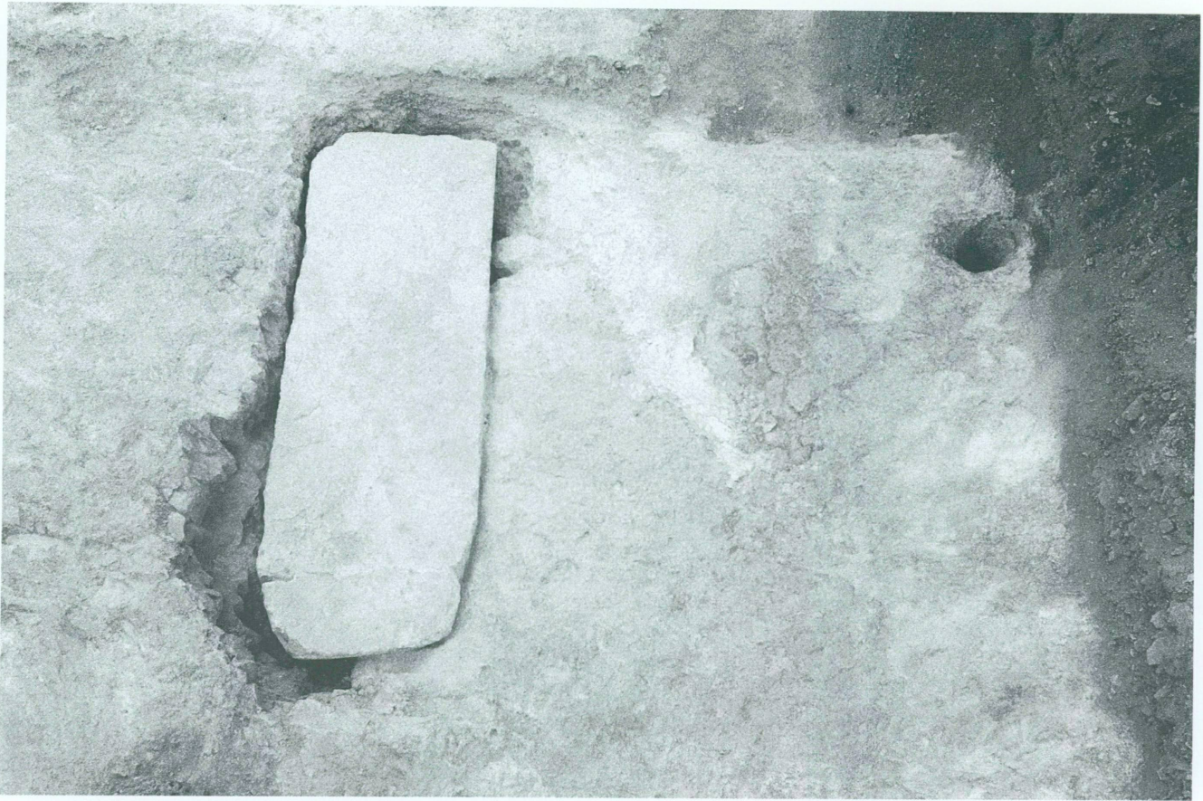
9. L'angle nord-est de la pyramide, avec la dalle de couverture du dépôt de fondation in situ (1996)

L'altitude du dépôt (niveau: 157,10 m) doit également être prise en compte et située dans l'ensemble de la construction de la pyramide. A cet égard, il n'est pas indifférent de mentionner que le niveau inférieur de la fondation déversée sur l'arête septentrionale se situe au pied de la descenderie, à l'altitude d'environ 157,30 m (fig. 3). De son côté, le dégagement de l'angle nord-est de la pyramide avait révélé la présence d'une dalle rapportée (2,00 x 0,78 x 0,28 m), hermétiquement jointoyée au mortier de plâtre, à l'extrémité nord-est du tétraèdre. Son emplacement et l'exécution de son scellement, dans le substrat calcaire, désignaient un dépôt d'angle (fig. 9). La dépose de ce monolithe a effectivement montré l'existence d'une fosse, soigneusement taillée, qui avait conservé le souvenir du jet d'une poignée de sable 13 . Or, l'altitude du fond de cette cavité, mesurée à 157,60 m (soit environ 0,35 m au-dessous du niveau du substrat), est très proche de l'altitude de la trouvaille de la descenderie. Elle invite donc à penser que ces dépôts furent effectués conjointement, au moment du début des opéra-