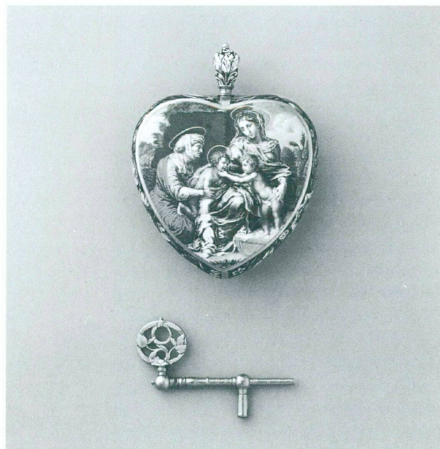
16. D'après Giulio Romano, Petite Sainte Famille, peinte sur émail sur une montre signée Johann Martin/Augsburg, vers 1680. Diam. 42 mm. Collection particulière