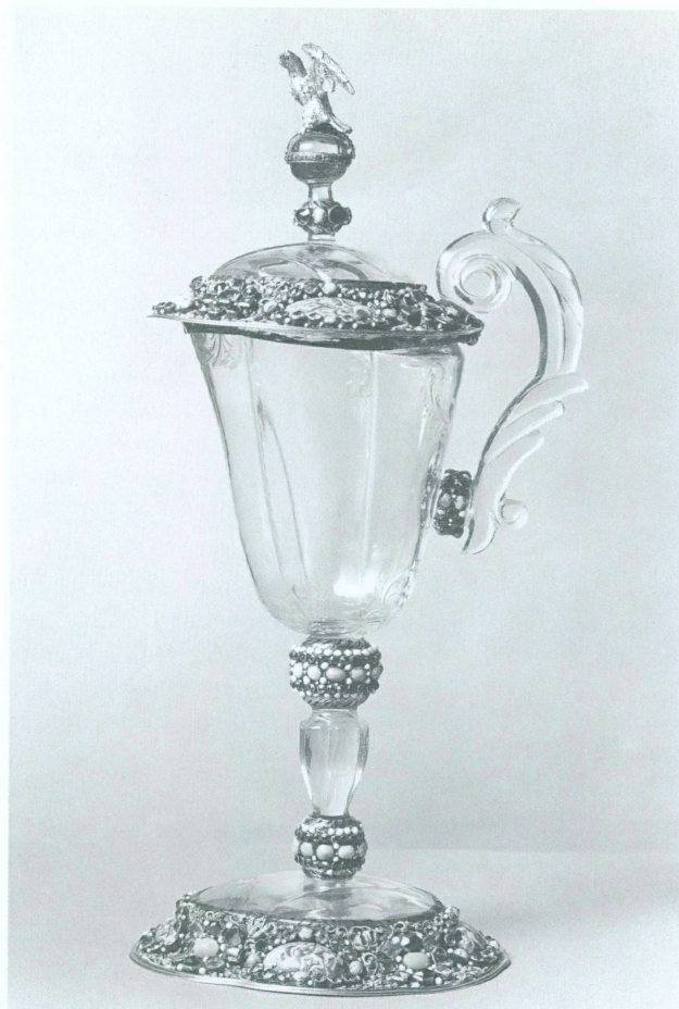
4. Aiguière d'apparat exécutée par l'orfèvre Jakob Mair, Augsbourg, vers 1686. Cristal de roche taillé, monture en vermeil, décor en relief à l'émail polychrome, pierres précieuses, six médaillons peints sur émail. Haut. 33,9 cm. Vienne, Kunsthistorisches Museum, Inv. 2369

Ces observations peuvent être reconduites à propos d'un ensemble d'apparat dû à l'orfèvre augsbourgeois Hans Jakob Mair (vers 1641-1719), qui se trouve en étroite relation avec la cassette. Conservé au Kunsthistorisches Museum de Vienne 23 , il se compose d'une aiguière et d'un bassin. Les deux objets sont constitués d'une monture en vermeil dans laquelle s'insèrent neuf éléments en cristal de roche taillé. Les montures sont entièrement recouvertes d'un décor en relief à l'émail polychrome, d'une riche garniture de pierres précieuses ainsi que de douze médaillons peints sur émail. Sur la base du poinçon de contrôle augsbourgeois, Helmut Seling a daté cet ensemble vers 1686 24 .