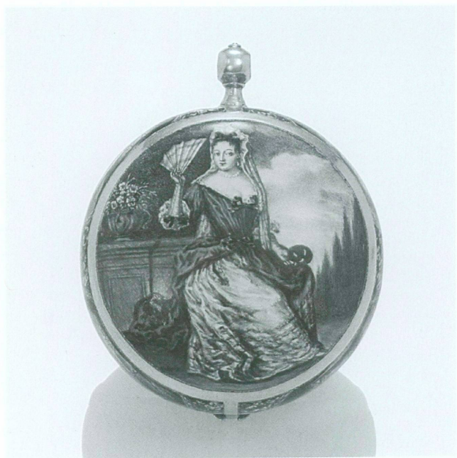
17. Peinture sur émail par Johann Jakob Priester, sur une montre signée Michael Hoffrichter/Augustae Vindelicorum. Augsbourg, vers 1710. Diam. 36,7 mm. Collection particulière

Traduction: Françoise Senger et la rédaction