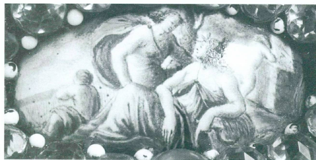
9. L'Été, d'après Nicolas Perelle, détail du pied de l'aiguière