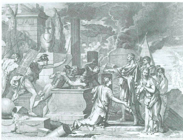
2. Samuel Bernard d'après Sébastien Bourdon, Ulysse découvrant Astyanax caché dans la tombe d'Hector dans Troie en flammes, et Andromaque l'implorant d'épargner la vie de son fils. Eau-forte et burin, 36,8 x 51,3 cm. Paris, Bibl. Nat., Estampes, Da 32a, fo 51