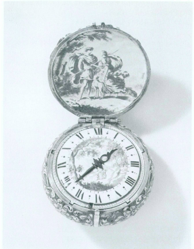
13. Vénus et Enée, peint sur émail, probablement par Johann Conrad Schnell, sur une montre signée Jeremias Pfaf/Aug, fin XVII e siècle. A droite: Face intérieure du couvercle et cadran de la montre. Diam. 38,3 mm. Genève, Collection Hans Wilsdorf-Rolax, Inv. 112 (voir aussi pl. II)