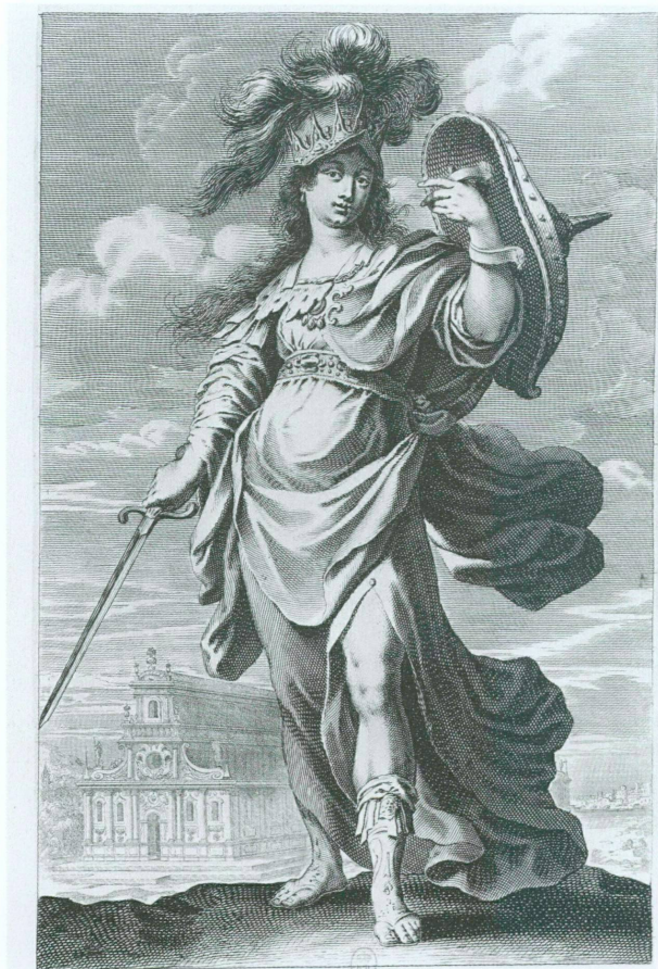
Joy donne de la gloire au plus grand des miracles ANTIOPE Six vingt riches piliers bâtis par mon exemple A ce temple ou Diane a rendu tant d'oracles Dans la ville d'Éphèse on fust le temple. En qui toute l'Asie a trouvé de l'employ Et la main d'or colonne est l'ouvrage du Roy.

Un gobelet à couvercle reposant sur trois pieds sphériques, conservé au Bayerisches Nationalmuseum de Munich, a été attribué jusqu'à présent à la France ou à la Suisse, alors qu'il provient lui aussi d'un atelier d'émail d'Augsbourg 30 . Ses peintures polychromes ont été réalisées d'après les Femmes fortes et les Sibylles de Claude Vignon (1593-1670), et ses motifs allégoriques s'inspirent à l'évidence d'un modèle néerlandais dans l'entourage de Otho van Veen (1556-1629). L'ensemble est très proche, dans sa palette de couleurs, des médaillons du bassin dont il vient d'être question, et donne un bel exemple de la résille de points de couleur que nous venons d'expliquer 31 .