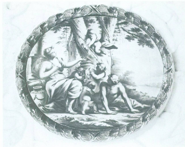
3. D'après Michel Dorigny, Scène bachique, peinte sur émail sur le côté droit de la cassette comme allégorie de la Terre

du bas à gauche et celui du haut à droite doivent encore être mentionnés ici. Celui de gauche représente La métamorphose de Coronis en corneille par Apollon , d'après une eau-forte de Laurent de La Hyre (1606-1656) 14 , et celui de droite une autre scène bachique de Dorigny, extraite du RECVEIL mentionné ci-dessus 15 .