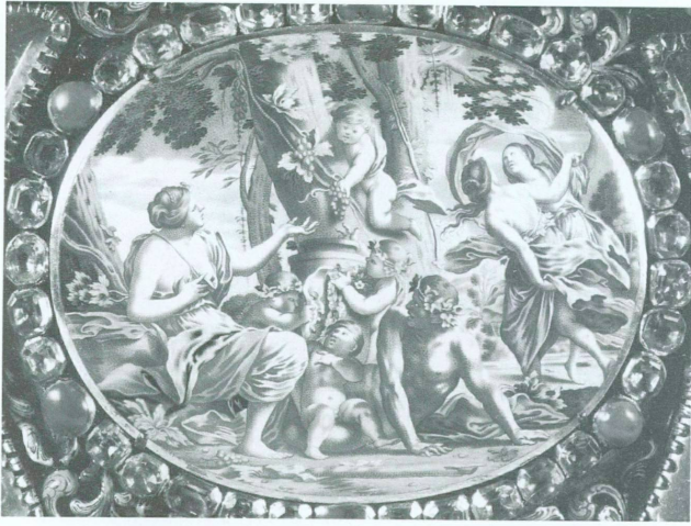
6. Allégorie de la Terre, détail d'un médaillon du bassin