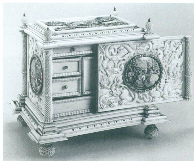
1. Cassette, Augsbourg, vers 1685. Ivoire sculpté, neuf médaillons peints sur émail. Haut. 19,6 cm. Brunswick, Musée Herzog-Anton-Ulrich, Inv. 181

Augsbourg, et bien sûr Genève en raison de ses relations étroites avec les centres spécialisés en France, sont en réalité les seuls lieux où, dans le contexte d'après 1680, la peinture sur émail était en pleine évolution aux plans artistique et technique dans les domaines qui nous intéressent. Comme on pourra le constater, des conditions étonnamment similaires ont joué un rôle dans ces deux villes. A l'époque, si elles fournissaient toutes deux les cours ainsi que des centres commerciaux importants, elles proposaient