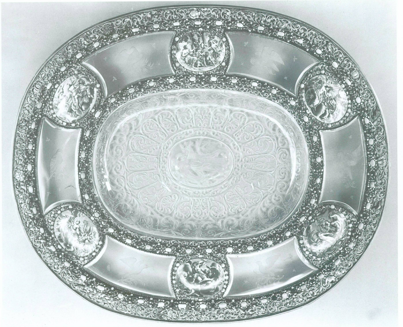
5. Bassin d'apparat exécuté par l'orfèvre Jakob Mair, Augsbourg, vers 1686. Cristal de roche taillé, monture en vermeil, décor en relief à l'émail polychrome, pierres précieuses, six médaillons peints sur émail. 45 x 54,9 cm. Vienne, Kunsthistorisches Museum, Inv. 3226

les médaillons qui ornent la cassette de Brunswick parle à elle seule contre cette éventualité, même si les émaux de Vienne témoignent d'une plus grande richesse de dégradés ainsi que d'une exécution beaucoup plus soignée qui laisse à penser que cet ensemble a été réalisé un peu plus tard.