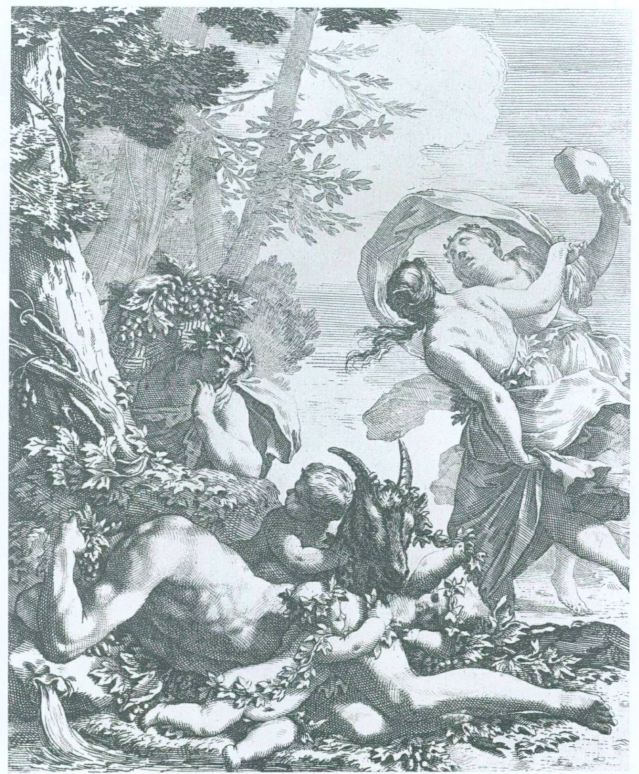
7. Michel Dorigny, deux scènes bachiques du RECVEIL DE DIVERSES BACCANALLES . Eau-forte et burin, ca. 25,5 x 20 cm chacune. Vienne, Albertina, F III, 10, fos 51 et 53