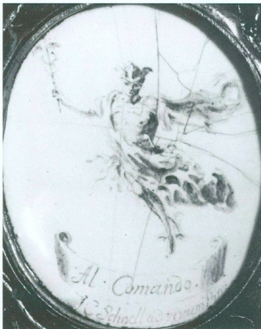
14. Signature de Johann Conrad Schnell sur le contre-émail d'un médaillon inséré dans le couvercle d'un petit coffret en vermeil, Augsbourg, vers 1700. Angleterre, collection particulière