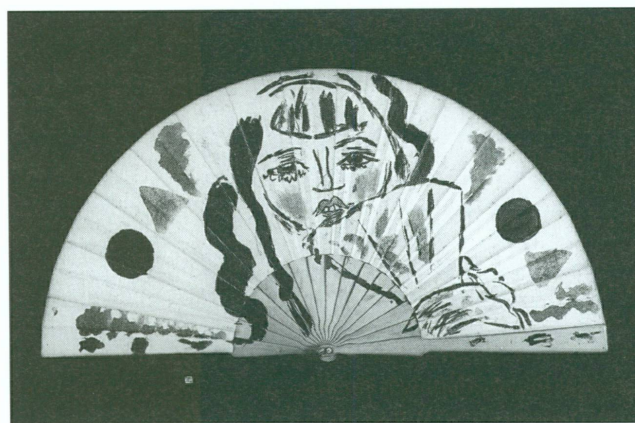
3. Marque de L'Eventail par Maurice Barraud, vers 1917. Gouache sur éventail en toile, 36 × 72 cm. Collection particulière

Le choix du titre, L'Eventail , reste une source d'interrogation. Cet accessoire féminin, en passe de disparaître, évoque l'élégance et la coquetterie. Sa forme très esthétique séduit nombre d'artistes. Picasso l'utilise dans sa Femme avec éventail ( Après le bal ) en 1909. Henri Laurens également dans son relief en bronze de 1921 Femme à l'éventail , et tant d'autres. Mais qui plus que Maurice Barraud l'a fait intervenir dans son œuvre ? L'éventail revient à cette époque sur de nombreuses toiles, eaux-fortes, affiches. L'artiste aime voir ses fausses vierges fardées jusqu'à l'outrance se dissimuler derrière cet accessoire dans un geste d'ultime pudeur. L'éventail déplié cache la réalité, fermé, il la révèle au contraire du livre et de la revue. Plus prosaïquement, peut-être veut-on insister sur la diversité de la production littéraire et artistique dont on veut refléter la richesse. Quoiqu'il en soit, l'adoption de ce titre laisse entrevoir l'importance du rôle joué par Barraud dans cette entreprise. Son influence est d'ailleurs omniprésente tant la complicité d'inspiration avec Laya est évidente. Il compose la marque de la revue, bien mise en évidence au milieu de la couverture de chaque numéro, l'affiche et d'autres œuvres en rapport. Il fait intervenir naturellement ses amis du Falot qui marquent de leur art l'existence de la revue. Barraud anime cette