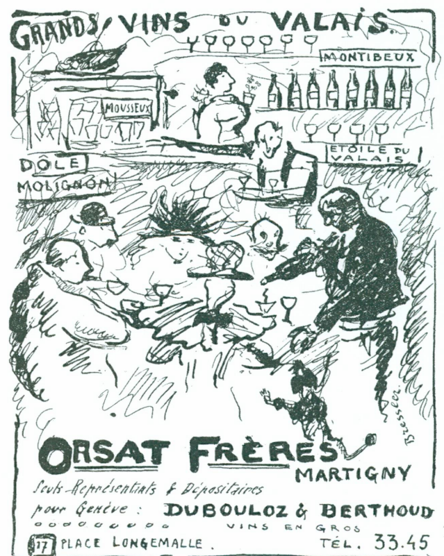
5. Publicité d'Emile Bressler parue pour la première fois dans L'Eventail , n° 3, 1918. Genève, Bibliothèque publique et universitaire

Une des originalités artistiques de L'Eventail se découvre dans ses publicités illustrées. Vers 1910, Maurice Barraud et son frère Gustave s'étaient associés pour ouvrir un atelier de