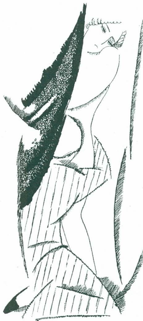
7. Illustration de Gustave Buchet pour Douze nuits de Claude Misery, 1918. Genève, Bibliothèque publique et universitaire

Laya vit un des moments les plus difficiles de sa revue :