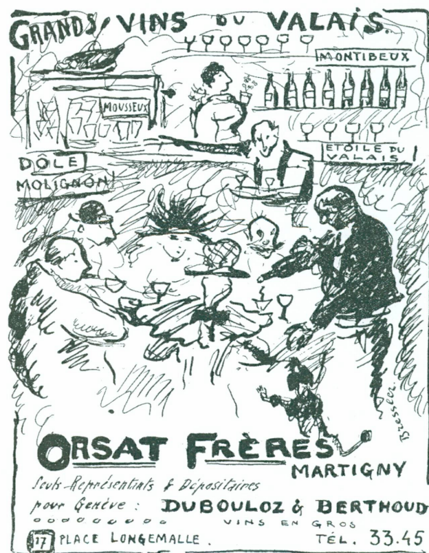
5. Publicité d'Emile Bressler parue pour la première fois dans L'Eventail , n° 3, 1918. Genève, Bibliothèque publique et universitaire

Une des originalités artistiques de L'Eventail se découvre dans ses publicités illustrées. Vers 1910, Maurice Barraud et son frère Gustave s'étaient associés pour ouvrir un atelier de