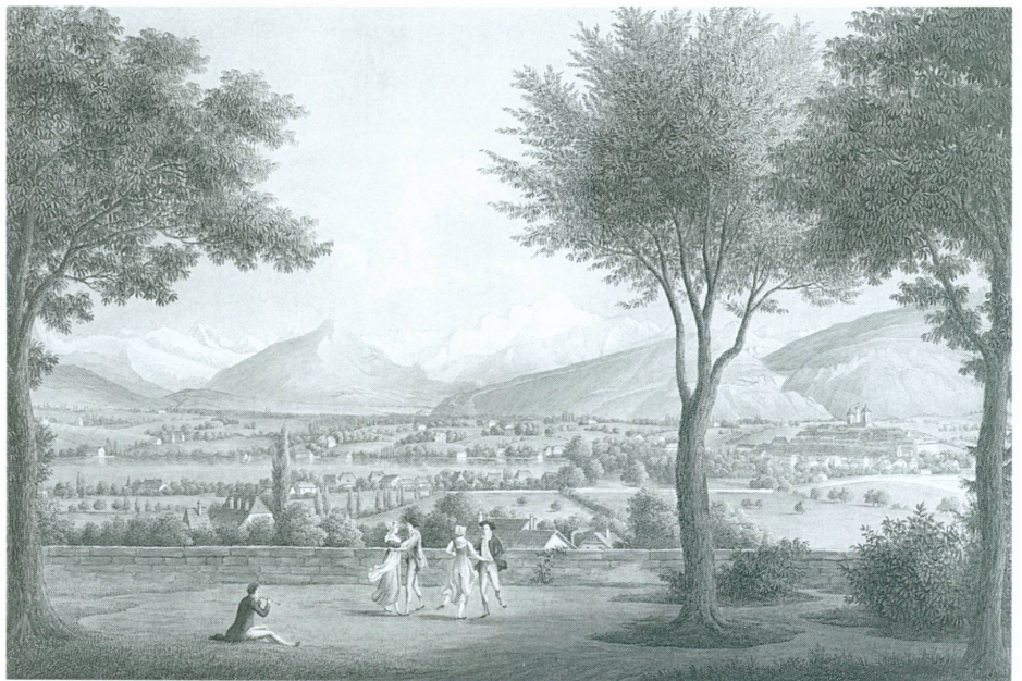
4. Frédéric Frégevize | Panorama des Alpes vu du Petit-Saconnex , début du XIX e siècle gravure au trait coloriée | Collection particulière