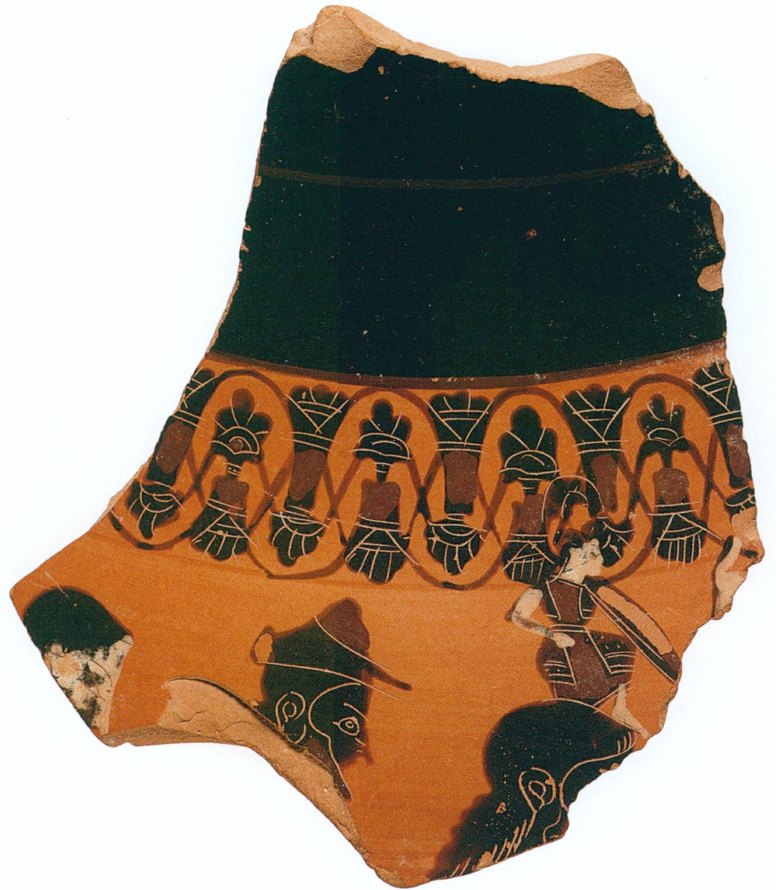
4. Le fragment du Sackler Museum