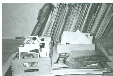
1. Voir au sujet de cette acquisition CHAPPAZ/JORDAN/COURTOIS 1999, p. 152