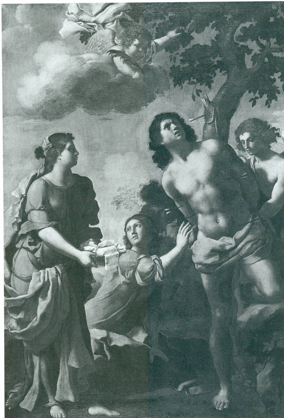
4. Giovanni Domenico Cerrini (1609-1681) Saint Sébastien soigné par les saintes femmes et les anges , avant 1640 | huile sur toile, 246 × 170,5 cm MAH (inv. 1839-14)

140. BPU, Ms. fr. 2244, f° 74, Lausanne, 14 avril 1830