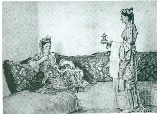
11. Jean-Étienne Liotard (1702-1789) | Servante levantine avec thière , vers 1740-1742 | Contre-épreuve de dessin de la fig. 10 (Paris, Bibliothèque nationale de France)