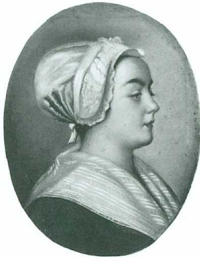
24. Auteur anonyme, d'après Jean-Étienne Liotard (1702-1789) | La Chocolatière , apparemment XIX e siècle | Pastel sur papier, 26 × 20 cm (Genève, Musée d'art et d'histoire, Cabinet des dessins, dépôt de la Fondation Gottfried Keller, inv. 1921-4)

13. Auteur anonyme | Huile sur toile, 72 × 49,5 cm | Non datée | Collection privée > Vente Koller (Zurich), 20 mars 1996, lot 74, repr. noir et blanc