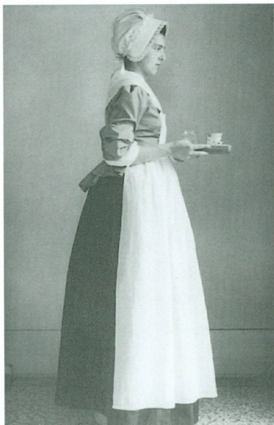
27. M me Isabelle Dominicé en Chocolatière, juillet 1942 | Photographie, 12,4 × 8,4 cm