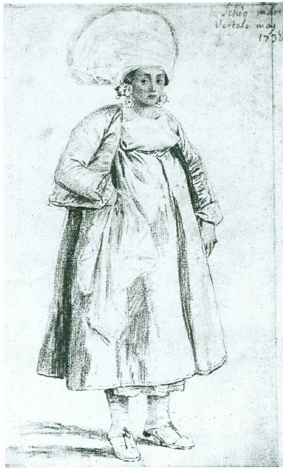
9. Jean-Étienne Liotard (1702-1789) | Marie Vestali , 1738 | Dessin, 21 × 13 cm (Paris, Musée du Louvre, Cabinet des dessins, inv. R.F. 1367)