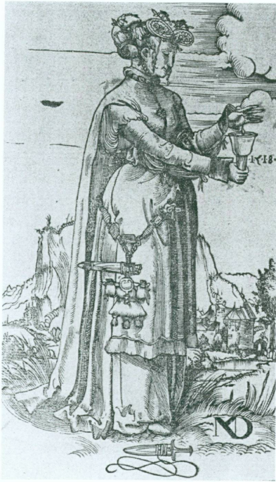
6. Niklaus Manuel Deutsch (1484-1530?) | Une Vierge sage , 1518 | Xylographie, 184 × 106 mm (Braunschweig, Herzog Anton Ulrich-Museum)