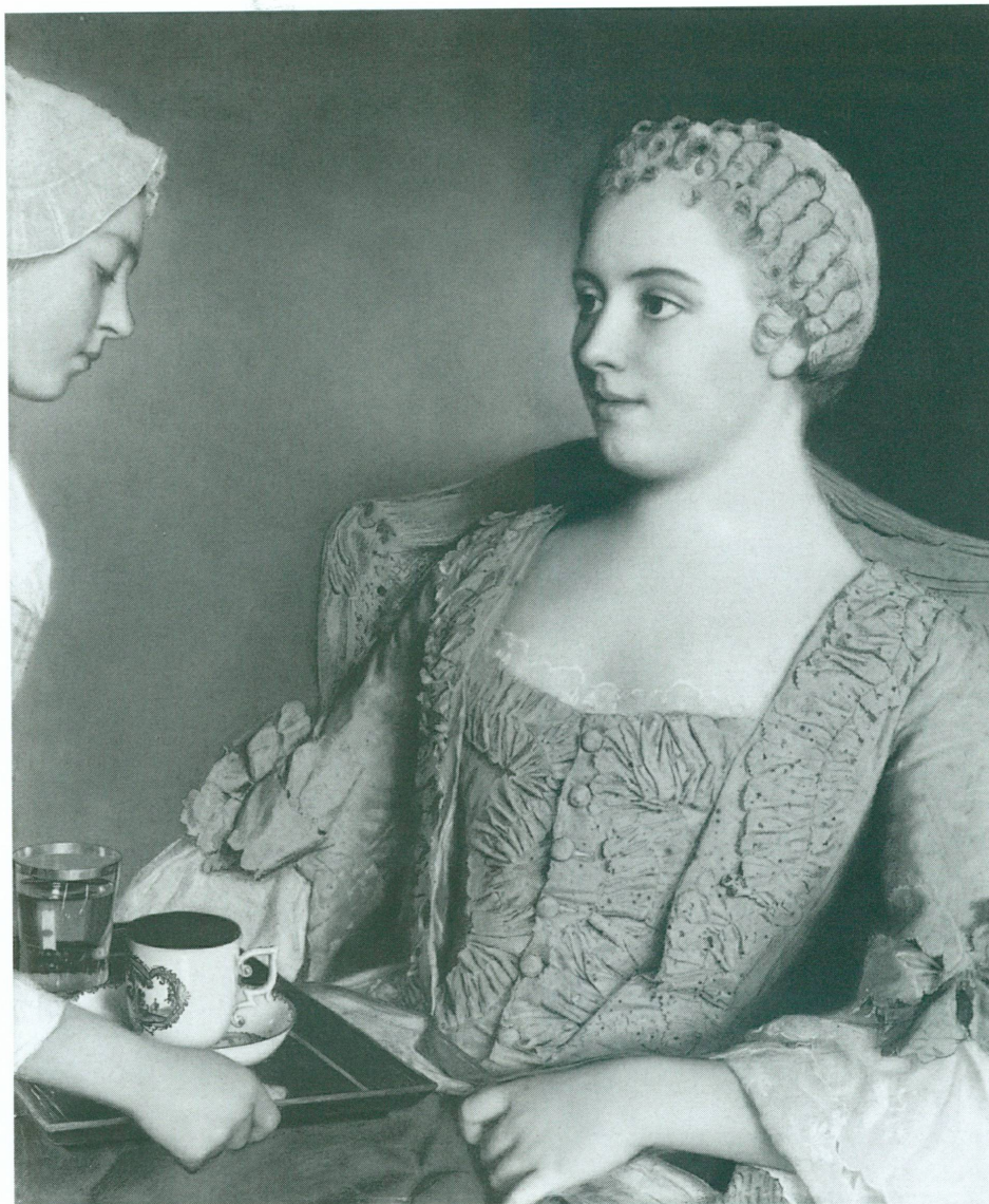
4. Jean-Étienne Liotard (1702-1789) | Le Déjeuner , vers 1754 | Pastel sur parchemin, 66,5 × 53,7 cm (Munich, Alte Pinakothek, dépôt de la Bayerische Hypotheken- und Wechsel-Bank, inv. HuW 30)