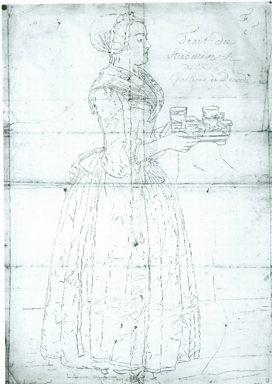
17. Jean-Étienne Liotard (1702-1789) | La Chocolatière , 1744? | Encre brune, 832/ 83,8 × 58,5 cm (Genève, Musée d'art et d'histoire, Cabinet des dessins, inv. 1935-8)

la fabrication du cadre insolite, il se fit un silence de presque quatre-vingts ans autour de La Chocolatière , d'autant que la seconde moitié du XVIII e siècle ne fut pas une période bénéfique pour la Saxe. Le catalogue de la galerie de 1765 est vierge de tout commentaire mais, en 1782, le tableau fut critiqué pour ses contours un peu trop tranchants, en 1811, en raison de ses proportions étriquées. Manifestement, le strict profil sur fond clair ne trouvait plus grâce. L'époque néoclassique n'éprouva guère d'intérêt pour ce pastel, trop sec aussi pour le romantisme. Rappelons que c'est précisément à Dresde que Johann Winckelmann (1717-1768) publia en 1755, peu avant son départ pour Rome, sa première étude, Gedanken über die Nachahmung der griechischen Werke in der Malerei und Bilhauerkunst ,