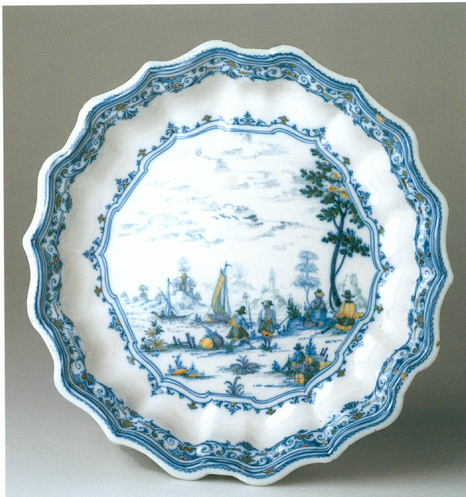
7. Manufacture Clérissy, Moustiers (France) | Assiette à décor aux marchands levantins, vers 1735-1740 | Faïence peinte en polychromie de grand feu, diam. 24,5 cm | Don de l'Association du Fonds du Musée Ariana (MA, inv. AR 2001-137)

de-Seine), vers 1755 (inv. AR 2001-238); une paire de drageoirs en forme de chardonnerets, faïence de Künersberg (Bade-Wurtemberg), vers 1770 (inv. AR 2001-219.1 et AR 2001-219.2); une soupière en faïence de Marseille, ornements en ronde-bosse et décor floral en polychromie de petit feu, 1760/1765 (inv. AR 2001-244), et une paire de figurines représentant un chasseur et une chasserresse, faïence de Niderviller (Meurthe-et-Moselle), 1770/1775 (inv. AR 2001-266.1 et AR 2001-266.2).