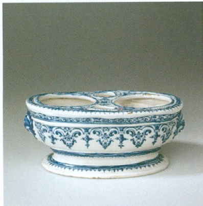
6. Manufacture Clérissy, Moustiers (France) | Porte-huilier à décor Bérain, 1725/1750 | Faïence peinte en bleu de grand feu, larg. 24 cm | Don de l'Association du Fonds du Musée Ariana (MA, inv. AR 2001-144)