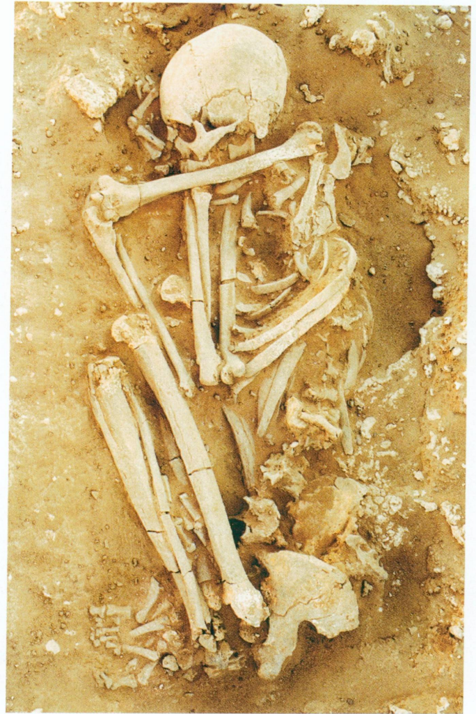
9. Tombes masculines découvertes dans l'habitat d'El-Barga. Les individus ont été inhumés après avoir été placés à l'intérieur d'un sac en cuir, aujourd'hui disparu. La disposition particulière de certains de leurs membres résulte du fait que les corps ont été ensevelis dans des positions forcées.

à l'attribution chronologique de certaines inhumations. Les tombes situées dans le secteur nord, c'est-à-dire dans la zone d'habitat mésolithique, sont incontestablement contemporaines de cette dernière. Elles ne contiennent généralement pas de mobilier, ce qui est conforme aux connaissances actuelles sur les rites funéraires de cette époque. En revanche, les individus du secteur sud sont régulièrement accompagnés d'offrandes, ce qui pourrait indiquer leur appartenance à une période légèrement plus tardive. Des datations au radiocarbone sont en cours d'analyse afin de préciser ce point.