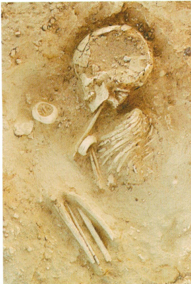
10. Tombe du secteur sud d'El-Barga contenant un enfant d'environ six ans avec deux bracelets en ivoire d'hippopotame