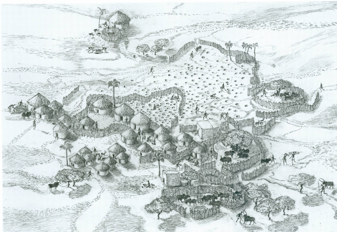
2. Reconstitution du village pré-Kerma réalisée à partir des données archéologiques et des comparaisons ethnographiques

avant d'atteindre le niveau d'occupation. Cette tâche, réalisée à main d'homme, représentait un investissement trop important par rapport aux résultats escomptés.