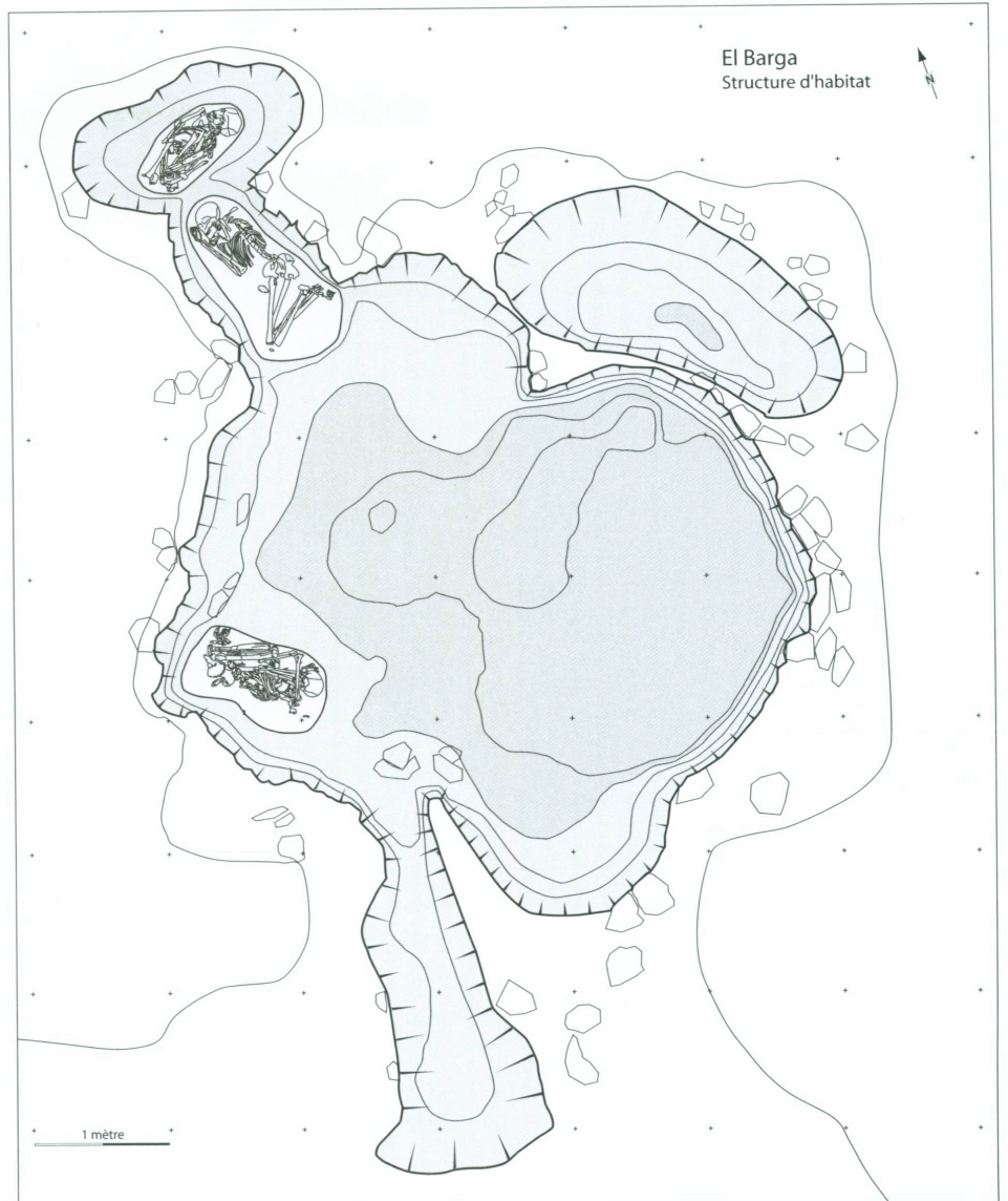
5. Plan de la structure d'habitat d'El-Barga avec trois individus inhumés à l'intérieur ou à proximité immédiate. Équidistance des courbes de niveau : 10 cm.

dépasse les cinquante centimètres (fig. 5). Du côté oriental, ses parois sont presque verticales tandis que, vers l'ouest, une sorte de banquette intermédiaire interrompt une pente plus douce. Au sud, une dépression allongée se dessine clairement ; aménagée dans la direction opposée au vent dominant, elle correspond probablement à l'entrée de la cabane. Au nord-est, une fosse ovale, d'une profondeur d'environ trente centimètres, borde le creusement central. Trois sépultures masculines sont en relation avec la structure d'habitat. L'une a été installée à l'intérieur, au niveau de la banquette occidentale, tandis que les deux autres sont situées juste en bordure (fig. 5 et 9).