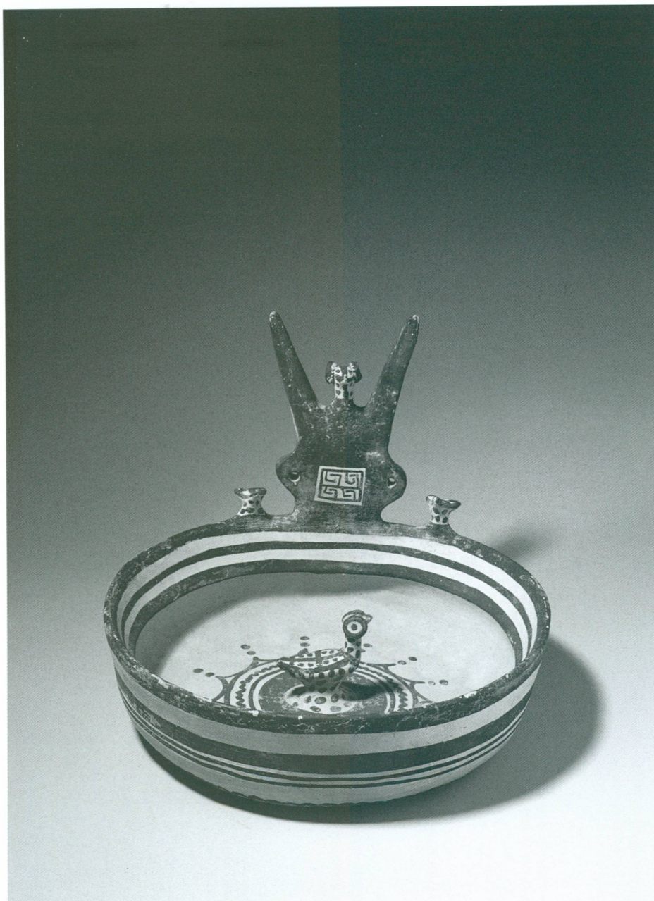
6. Kyathos cornu à l'oiseau , Daunien II, probablement Ortona | Argile claire, engobe blanc cassé, peinture brun-violet, haut. 20 cm × Ø 25 cm (MAH, inv. 20153)

céramique produite dans la région adriatique par les peuples indigènes qui, du VII e au III e siècle av. J.-C. (fig. 6), vivaient en marge des colonies grecques, a permis de réunir des pièces rares provenant toutes de collections genevoises, hormis deux d'entre elles, prêtées à titre exceptionnel par le Paul J. Getty Museum de Malibu. Le catalogue de l'exposition, dans lequel chacun de ces objets est reproduit en couleurs, fera date puisqu'il s'agit du premier livre d'art jamais consacré aux Iapyges. Cette exposition permet également au Musée, après L'Art des peuples italiques en 1994, de renouer avec la Mona Bismarck Foundation de Paris, où elle a été présentée en février 2003.