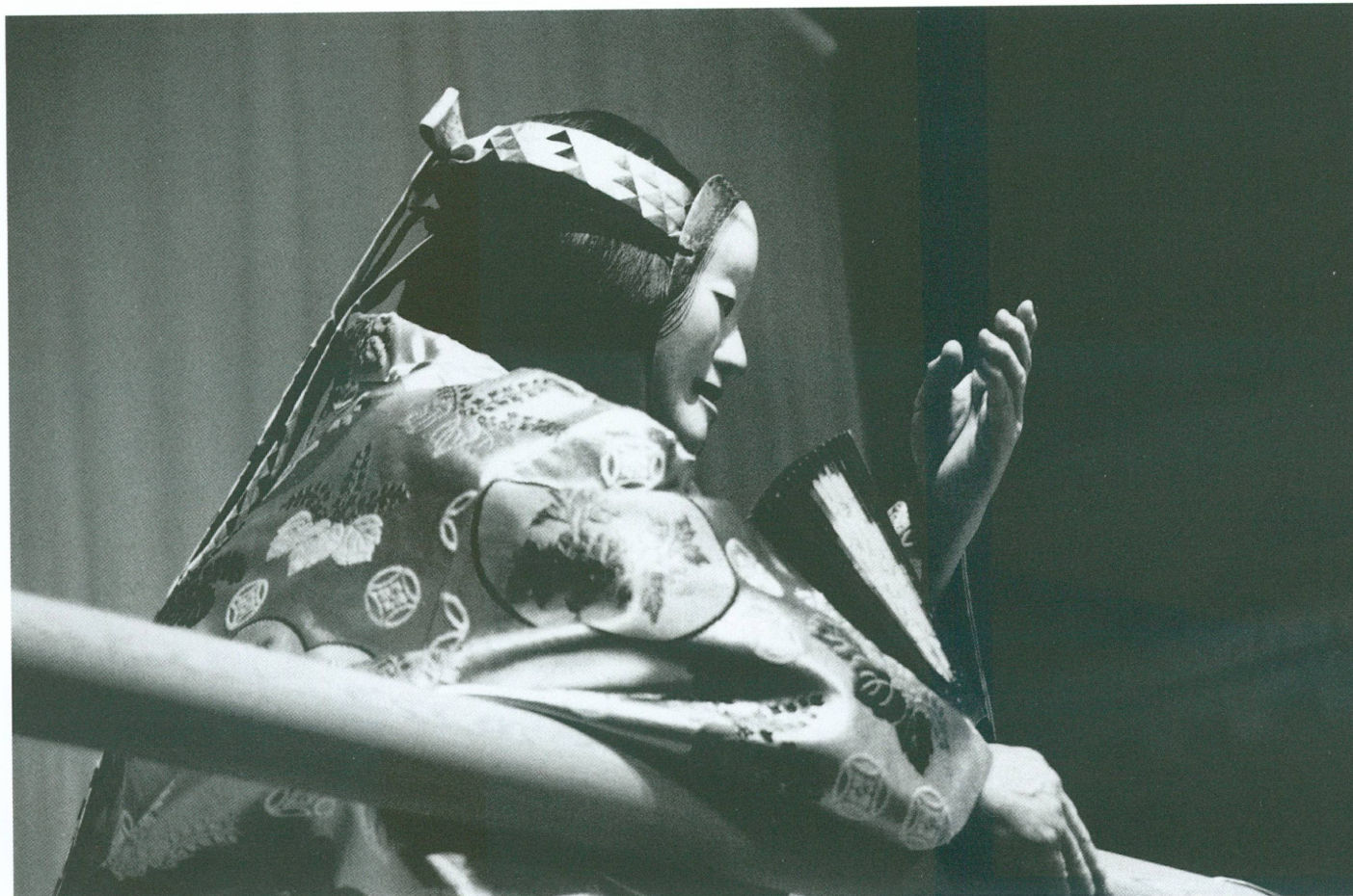
3. Représentation de théâtre nô à la salle communale de Plainpalais

Kizuki Takayuki, les 6, 7 et 8 décembre 2002 (fig. 3). Ces trois soirées furent organisées par le Musée d'art et d'histoire. La création de ce double événement a été rendue possible grâce au soutien de JTI et à l'aide généreuse de notre fidèle partenaire l'UBS, dont l'engagement permet au Musée d'art et d'histoire de mener à terme ses projets les plus ambitieux. Réjouissons-nous également des liens privilégiés tissés autour de ces manifestations avec le journal Le Temps , la revue L'Œil et la Radio suisse romande Espace 2 .