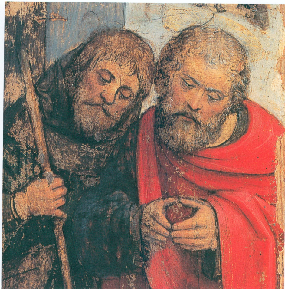
5. Collaborateur de Defendente Ferrari | Adoration des bergers , vers 1515-1518 | Tempera grasse sur bois de conifère, 116 × 64,5 cm (Genève, MAH, inv. 1980-208) | Détail

œuvre essentielle au corpus de l'exposition, propriété de la cathédrale de Biella, nous a permis d'en obtenir le prêt exceptionnel auprès des autorités italiennes.