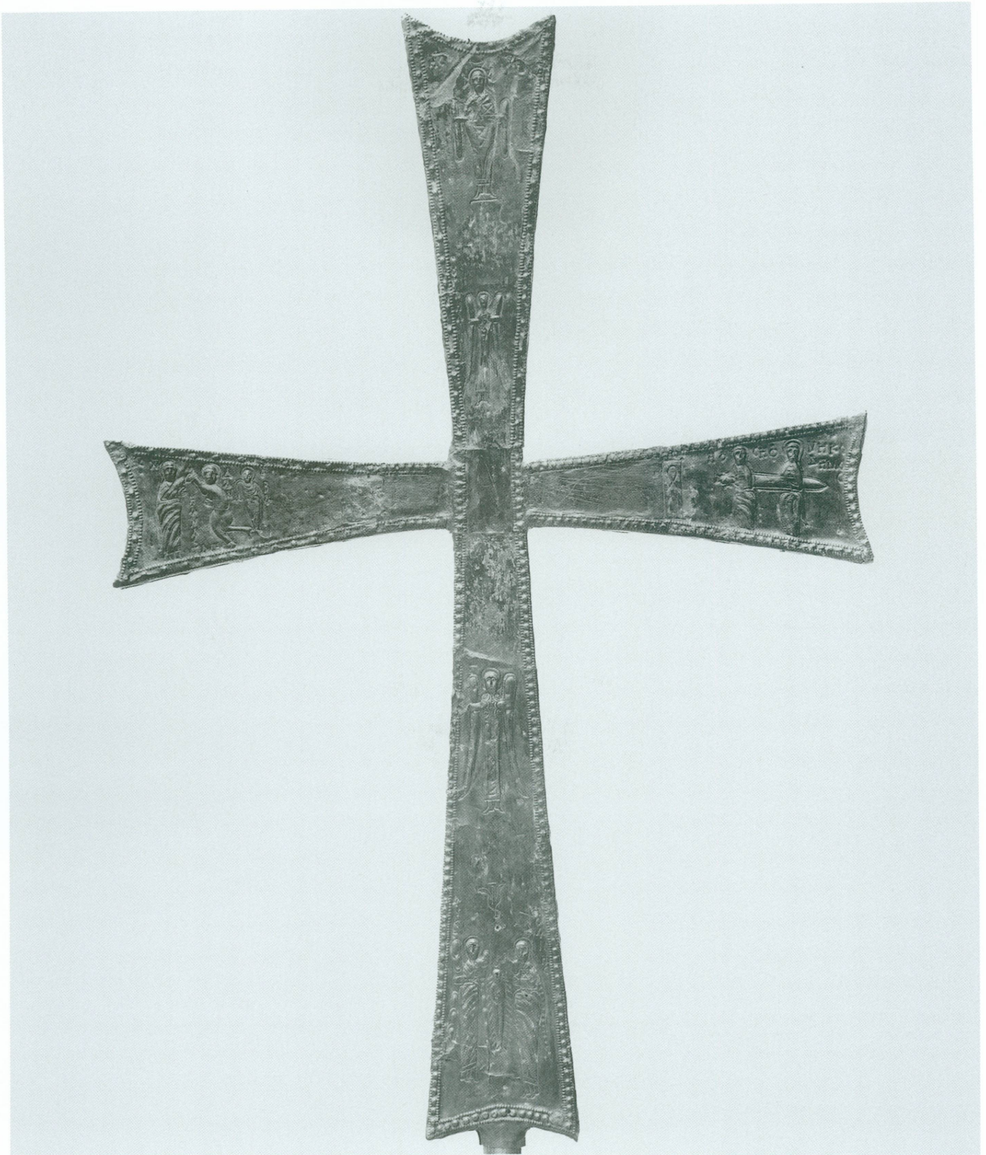
2. Croix de procession byzantine, XII e siècle | Bronze, 68 × 46,3 × 2,6 cm (MAH, inv. AD 2541) | Revers (ensemble)