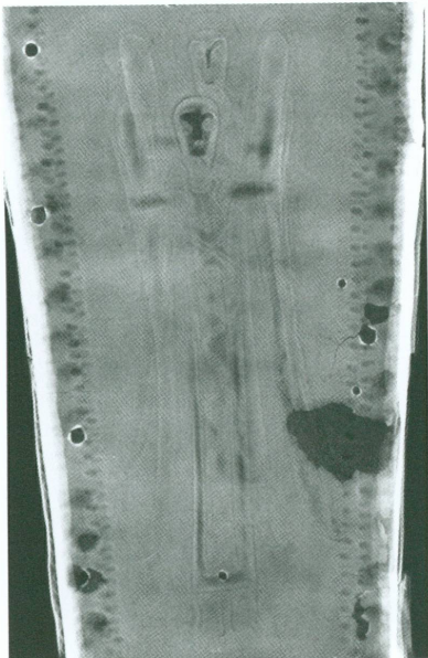
15-16. Croix de procession byzantine , XII e siècle | Bronze, 68 × 46,3 × 2,6 cm (MAH, inv. AD 2541) | Radiographies (de gauche à droite) :

15. L'archange Uriel (bas de la partie supérieure du revers)