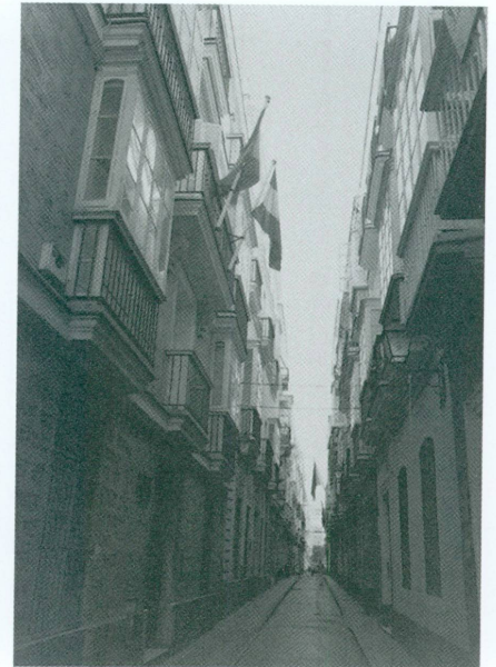
18. Calle Ahumada, domicile de Patricio Noble