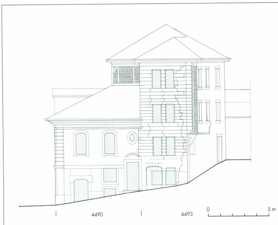
Vers le passage de Monnetier et le Perron · Façade ouest (parcelle 4493)

La façade qui regarde l'ancienne école, plus tard Bibliothèque de la Madeleine, a reçu, au XVII e siècle, sans doute, un traitement homogène lui aussi d'une grande austérité. Le mur d'assises régulières de longs blocs de molasse est percé de fenêtres géminées élancées, soulignées de battues recevant les volets. Cette apparente unité est cependant trahie à droite par une ligne verticale de rupture d'assises qui sépare la façade de sa chaîne d'angle, souvenir d'une façade antérieure qui s'appuyait, sans toutefois en être solidaire, sur l'appareil de briques du milieu du XV e siècle (fig. 7).