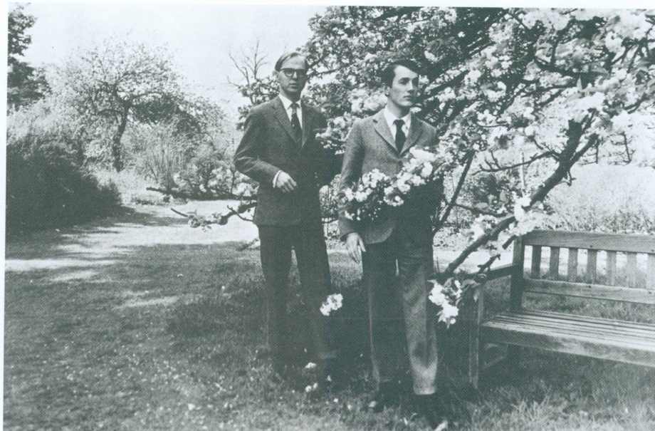
A TOUCH OF BLOSSOM.