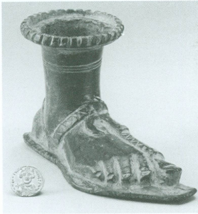
1. Récipient en forme de pied droit accompagné d'un solidus de Constantin II (648-649), Empire byzantin, 648-649 | Bronze coulé, 8 × 14 × 5,2 cm ; Ø extérieur de la cavité 6 cm (MAH, inv. CdN 2004-689 (solidus) et AA 2004-203 [dons de la Fondation Migore, legs Janet Zakos])

1. Les numéros d'inventaire des œuvres données par la Fondation Migore, exécutrice des volontés de Janet Zakos, vont de AA 2004-114 à AA 2004-329.