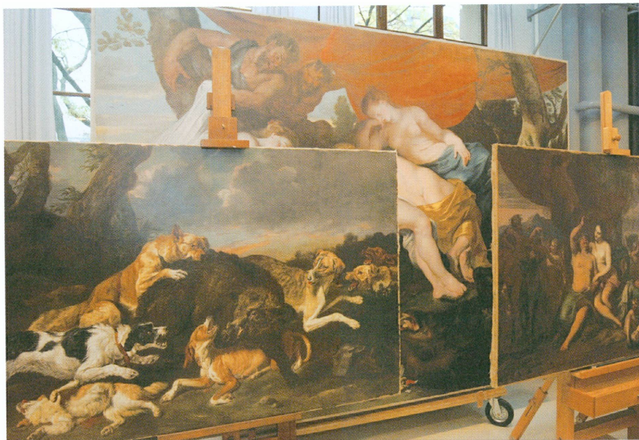
3 (à gauche). Vue de l'atelier de conservation-restauration de peinture du Musée d'art et d'histoire : campagne de restauration des fonds flamand et hollandais des XVII e et XVIII e siècles