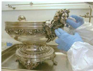
6. Atelier de conservation-restauration des métaux précieux : en vue de sa présentation dans la nouvelle salle d'argenterie du Musée d'art et d'histoire, traitement du bol à punch de l'«Alabama», création d'Edward C. Moore pour Tiffany & Co, New York, 1872 | Argent partiellement doré (MAH, inv. AA 17232)

été mis en œuvre. Son efficacité a été testée avec succès lors de l'exposition Philippe de Champagne . Dans le cadre de sa collaboration à la préparation des expositions temporaires, le secteur a été appelé à intervenir sur les objets archéologiques provenant de Gaza : les pièces les plus fragiles et instables ont été restaurées, les bronzes malades ont été traités, ainsi que plusieurs céramiques et verres fragiles. Les collections permanentes ont bénéficié de soins attentifs (fig. 6), divers lots d'objets antiques, byzantins, égyptiens, proche-orientaux et grecs ayant fait l'objet de traitements de restauration. Une campagne de contrôle de l'état des objets étrusques a été réalisée à l'occasion du démontage de la salle, avant travaux de rénovation.