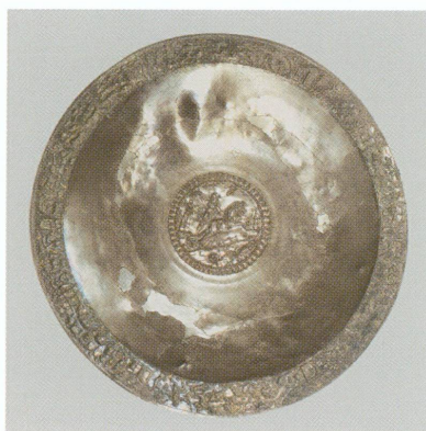
1. Plat au marli orné de scènes de chasse et au médaillon central représentant un aurige victorieux sur son bige dans l'arène du cirque, bassin oriental de la Méditerranée, fin du III e – début du IV e siècle ap. J.-C. | Argent rehaussé à la feuille d'or, Ø 52,7 cm (MAH, inv. A 2007-1 [don Monique et Gérard Nordmann, Vandœuvres])