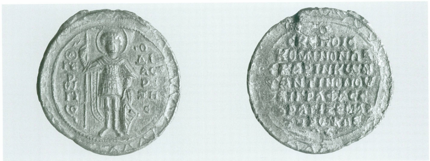
1 (en haut). Sceau de Constantin Lascaris Comnène, Byzance, entre 1193 et 1199 | Plomb, Ø 35 mm (MAH, inv. CdN 2004-228 [donation Janet Zakos, 2004]) | Avers et revers (éch. 1,5/1)