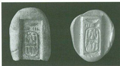
1 (en haut). Moule d'une plaquette inscrite, en forme de cartouche royal, provenance inconnue, Nouvel Empire, règne de Ramsès II, XIII e siècle av. J.-C. | Terre cuite, haut. 3,3 cm (MAH, inv. A 2008-2 [legs Friedrich Steffen, Genève, 2003])