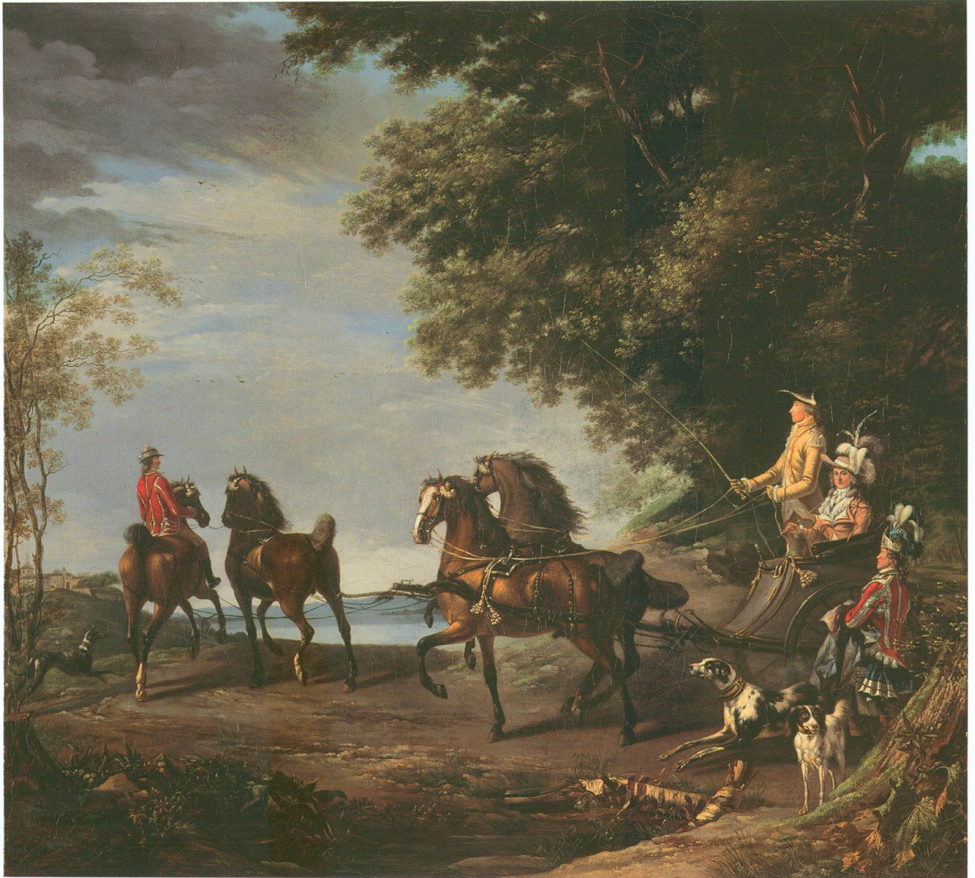
1. Louis-Auguste Brun, dit Brun de Versoix (Rolle, 1758 – Paris, 1815), Promenade du comte d'Artois et de son épouse en cabriolet , 1782 | Huile sur toile, 90 × 100 cm, signé et daté en bas au milieu : « Brun 1782 » (MAH, inv. BA 2008-197 [dépôt de la Fondation Jean-Louis Prevost, Genève])