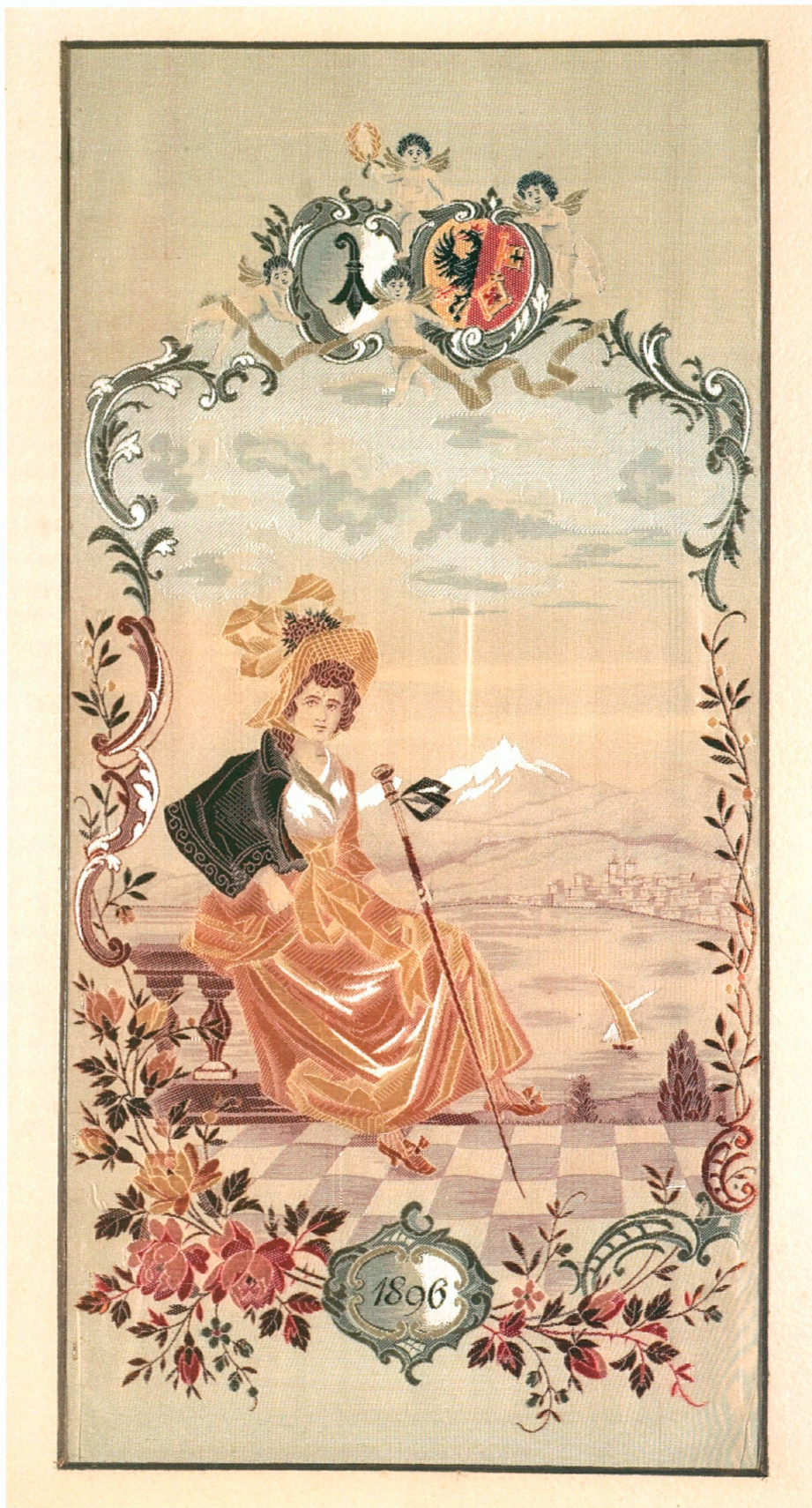
2. Tableau tissé encadré , Bâle, créé à l'occasion de la deuxième Exposition nationale, Genève, 1896 | Tissage au métier Jacquard, soie (chaîne et trame), passe-partout, 37 × 23 cm (MAH, inv. AA 2008-72 [don Dorothea Graf, Genève])