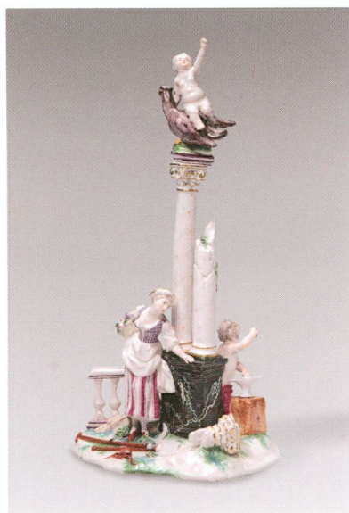
1. Niderviller | Les Quatre Éléments , vers 1765-1770 | Faïence, polychromie de petit feu, haut. 33,5 cm (MA, inv. AR 2009-543 [achat])