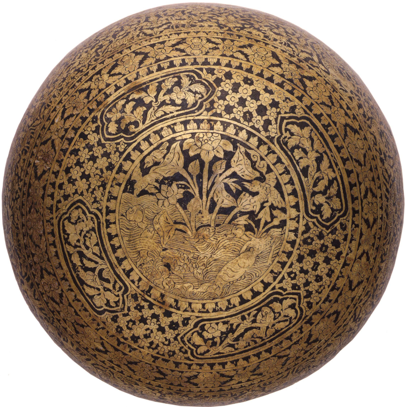
9 Bol à punch (détail du fond). Thaïlande, XIX e siècle. Argent ciselé, niellé et doré, haut. 17,2 cm, Ø 31,5 cm, don roi de Siam, Chulalongkorn, Genève, 1897. MAH, inv. M 524.