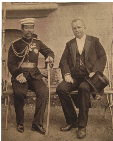
2 Le roi de Siam et Adolf Deucher (1831-1912), président de la Confédération suisse. Genève, Villa Plongeon, 27 mai 1897.