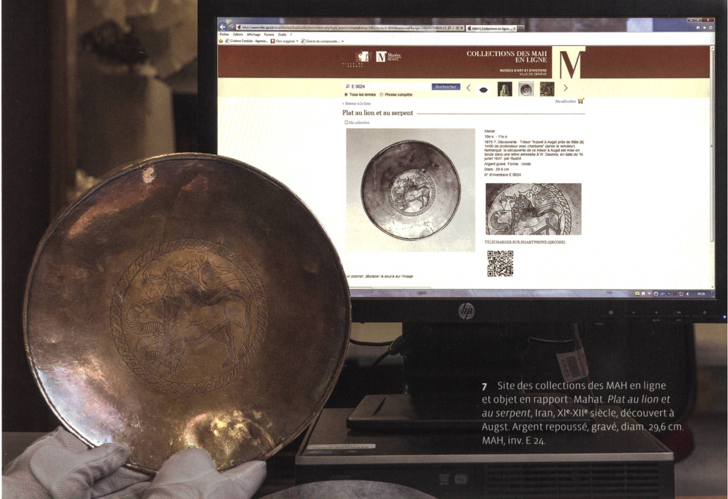
7 Site des collections des MAH en ligne et objet en rapport: Mahat. Plat au lion et au serpent , Iran, XI e -XII e siècle, découvert à Augst. Argent repoussé, gravé, diam. 29,6 cm. MAH, inv. E 24.

d'inventaire, de documentation photographique, de conservation curative et préventive, avant de regrouper toutes les collections dans un nouveau dépôt. De nombreuses autres institutions, notamment le Musée d'ethnographie de Genève, ont déjà expérimenté cette entreprise. Cela signifie traiter les objets un à un : contrôler s'ils sont déjà enregistrés informatiquement, établir leur fiche si ce n'est pas encore le cas, vérifier que les informations minimales sont saisies, effectuer une prise de vue documentaire si aucune photographie n'existe, enfin passer entre les mains des conservateurs-restaurateurs pour vérifier l'état sanitaire de l'œuvre en vue de sa maintenance. Le nombre de tâches à accomplir, multiplié par le nombre d'œuvres à traiter, donne un résultat légèrement vertigineux. Une seule constatation s'impose, il faudra aller vite!