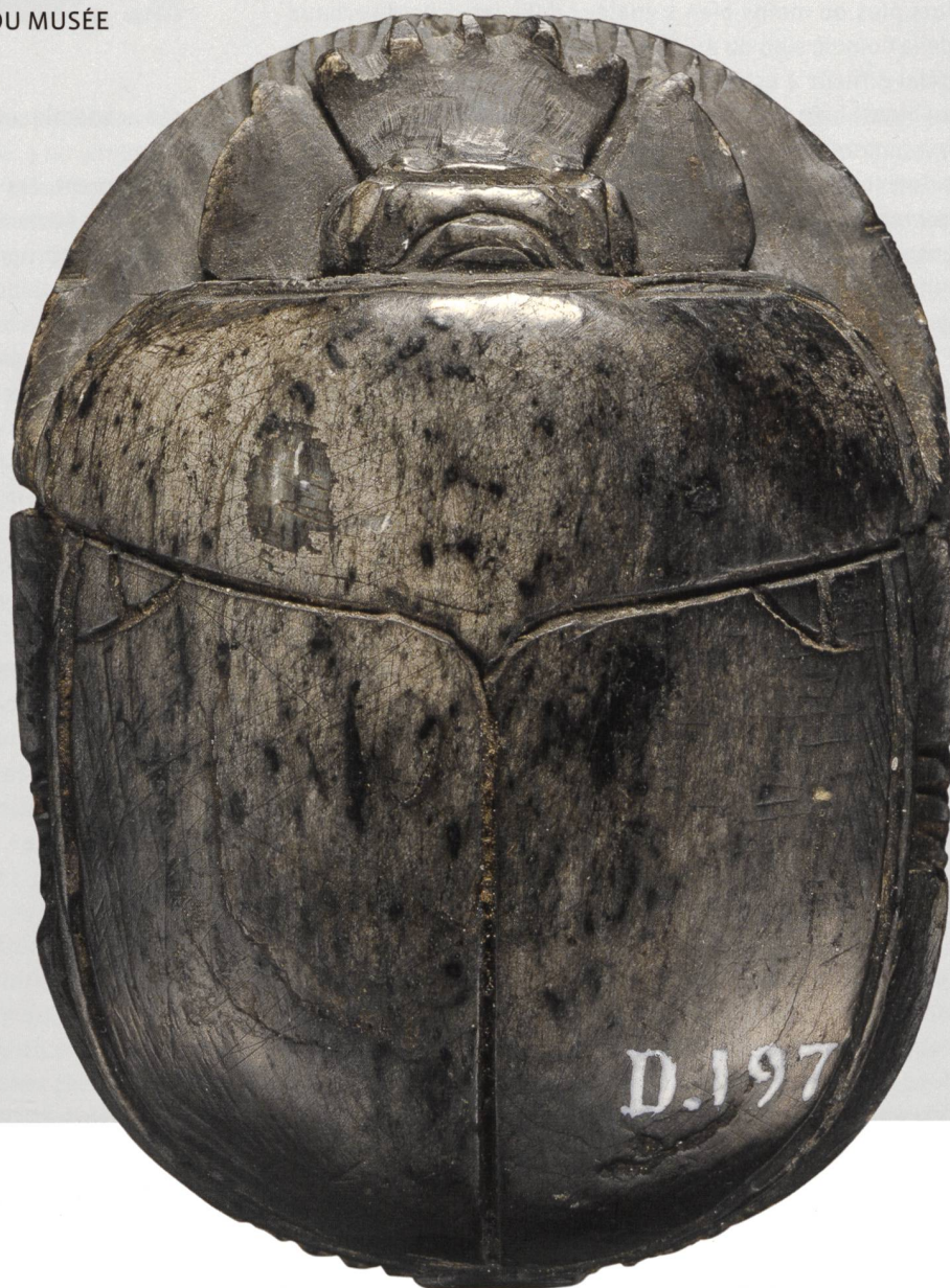
1 Scarabée de cœur inscrit du chapitre XXX B du Livre des Morts . Dos. Pierre dure noirâtre à reflets verts [?], 5,4 x 3,8 cm. MAH, inv. D 197.

L'ÉTUDE DES INVENTAIRES ANCIENS – ET CELLE DE LEUR DOCUMENTATION – PERMET BIEN SOUVENT DE RETROUVER L'ORIGINE DE QUELQUES OBJETS, VOIRE DE PLAIDER EN FAVEUR DE L'AUTHENTICITÉ DE PIÈCES CONTESTÉES. DIX PETITS (ET PLUS GROS) SCARABÉES RAPPELLENT LES ORIGINES DE LA COLLECTION ÉGYPTIENNE DU MUSÉE D'ART ET D'HISTOIRE.