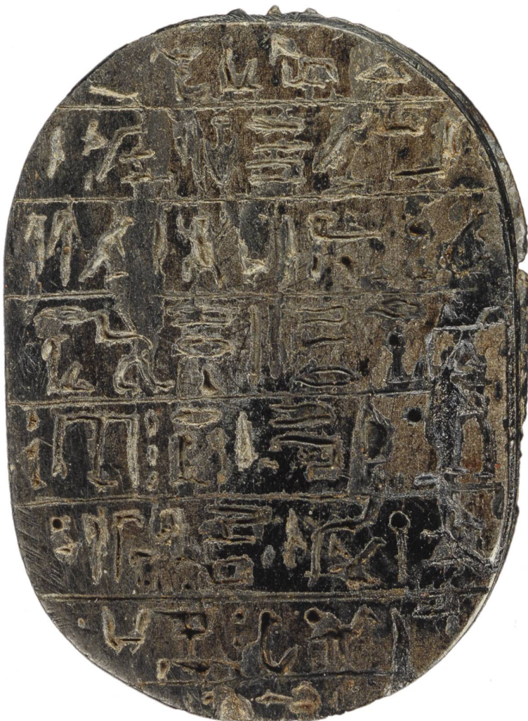
6 Scarabée de cœur inscrit du chapitre XXX B du Livre des Morts (plat). Pierre dure noirâtre à reflets verts [?], 5,4 x 3,8 cm. MAH, inv. D 197.

Pour conclure cette note, il me paraît en effet intéressant de revenir sur la question du scarabée D 196, attribuable à la Basse Époque, lui aussi très grand, et pour lequel nous avons noté les contradictions entre les diverses sources («petit»/vs taille réelle). Il est possible d'explorer une autre piste, celle de la matière. L'inventaire Gosse précise «terre émaillée», expression traduite par «céramique siliceuse bleu-vert» dans l'inventaire moderne, et qui désigne un matériau plus communément appelé «faïence égyptienne», quand bien même sa glaçure est quelque peu passée. Rien de semblable n'est