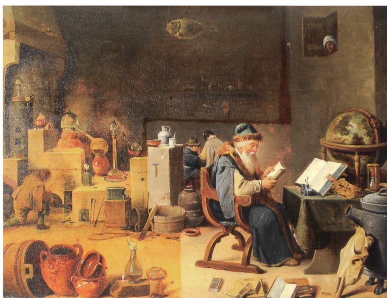
4 Vue de l'ensemble après le traitement.